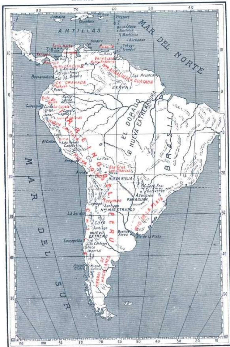
K. Brittan Rozpide fecit.