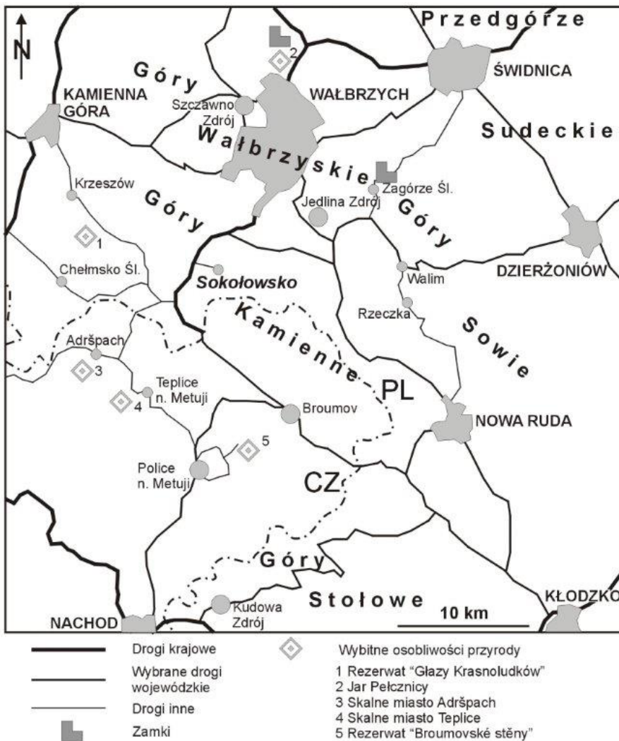
Rycina 2. Położenie Sokołowska względem głównych atrakcji turystycznych Sudetów Środkowych po stronie polskiej i czeskiej (opracowanie własne)

Książ – trzeciego pod względem kubatury w Polsce (po zamku w Malborku i Wawelu), z którym sąsiaduje rozległe założenie parkowe. Na liście Światowego Dziedzictwa UNESCO znajduje się od 2001 roku Kościół Pokoju w Świdnicy – unikatowy obiekt sakralny wzniesiony przez protestantów po wojnie trzydziestoletniej, w latach 1652–1654, zachowany w swej pierwotnej postaci do naszych czasów, mimo że został wzniesiony z nietrwałych elementów konstrukcyjnych. Do najczęściej odwiedzanych obiektów turystycznych w Sudetach należą także udostępnione do zwiedzania z przewodnikiem podziemne kompleksy w okolicach Walimia, Rzeczeki i Głuszycy, budowane pod koniec II wojny światowej jako kwatery Hitlera i naczelnego dowództwa wojsk niemieckich (Kowalski i wsp. 2009).