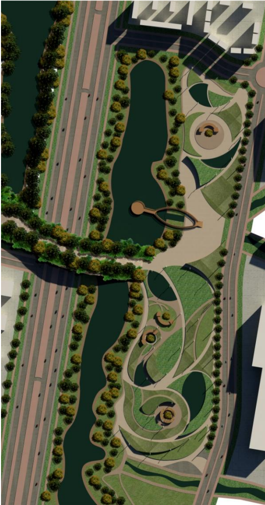
Vista general en planta del parque.