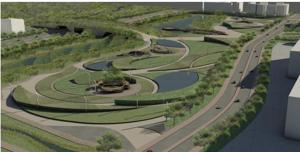
Vista general aérea del parque.