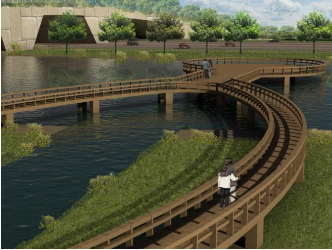
Muelle dentro del humedal.