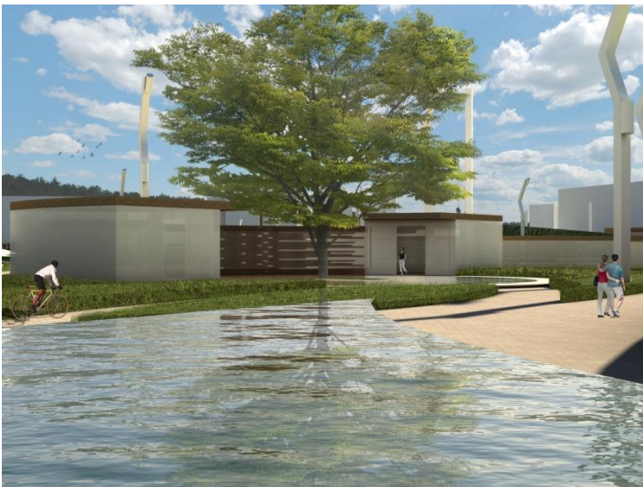
Aulas ambientales en el parque.