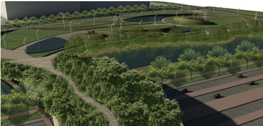
Puente verde conector del proyecto.