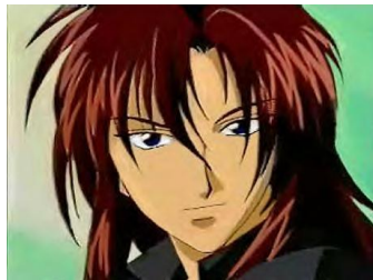
Figura 16 23 . Hiroshi Nakano de la serie Gravitation

Hiroshi Nakano : es un joven de 19 años, guitarrista de la banda Bad Luck y mejor amigo de Shuichi. Siempre demuestra comprensión y afecto hacia su amigo, y le duele mucho cuando Shuichi tiene problemas por culpa de Yuki. Está enamorado de Ayaka, la prometida de Yuki (ver figura 16).