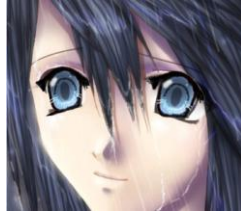
Figura 11 15 Representación típica de los ojos de personajes de anime

Cabello de colores: El cabello de los personajes es de colores diferentes para lograr una mayor diferenciación de los mismos. También es dibujado de varias formas, desarrollando nuevos peinados (ver figura 12).