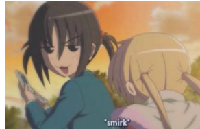
Figura 13b 18 clásica expresión “gatuna” en el anime