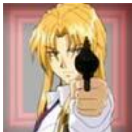
Figura 18 25 . Mr. K de la serie Gravitation

Mr. K: es el manager estadounidense de Bad Luck. Es un hombre decidido y muy extrovertido que usa métodos poco ortodoxos para conseguir todo lo que quiere. Le encantan las pistolas, y generalmente siempre lleva alguna consigo (ver figura 18).