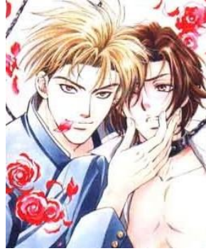
Figura 9 12 Representaciones de figuras masculinas del género Yaoi