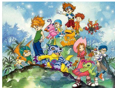
Figura 7 10 . Digimon del género Kodomo

Kodomo : este género está principalmente dedicado a los niños, y por lo tanto trata temáticas de su interés. Unas de las series más populares de este género son Pokemon y Digimon (ver figura 7).