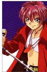
Figura 14 21 . Shuichi Shindou de la serie Gravitation

Shuichi Shindou : Vocalista de la banda de pop, Bad Luck, es un joven tierno y enérgico que ama su profesión. De cabello rosa y un estilo algo extravagante, admira profundamente a la agrupación Nittle Grasper y a su vocalista Ryuichi Sakuma, a quien tiene como inspiración para convertirse en un gran cantante. Se enamora perdidamente de Yuki Eiri, con el que sostiene una relación algo complicada. Es de carácter alegre y siempre se preocupa por las personas que ama (ver figura14).