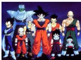
Figura 1: Dragon Ball

buenas eran estas series de acuerdo con las opiniones de los otakus . Al ver sólo comentarios positivos y alentadores, decidió empezar a verlas y las compartió con Jair. Al principio no le llamaron la atención hasta que empezó a discutir su temática con Silvia y a visualizar los diferentes contenidos que la serie proponía, haciendo énfasis en el tema de la masculinidad y de la homosexualidad explícitos en el anime .