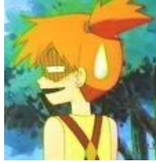
Figura 13a 17 Misty de la serie Pokemon