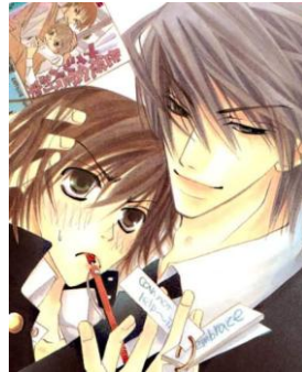
Figura 4 4

hombre de cabello castaño es considerado el “uke”, mientras que el de cabello gris es considerado el “seme”