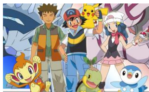
Figura 2: Pokemon