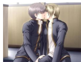
Figura 3: anime shonen ai

Silvia le comentó a Jair que lo que más le interesó de estas series, aparte de la relación homosexual, fue la trama, la cual la cautivó, debido a que desde su punto de vista, era muy original y tierna. Después de la serie, Silvia miró la ova (película corta que envuelve los personajes de la serie) y estuvo de acuerdo en que era muy interesante también. Poco a poco los dos fuimos profundizando mucho más en el mundo del anime shonen ai , y fue así como nos fuimos acercando profusamente, conociendo personas que compartían nuestros mismos intereses. Fue así como conocimos a Darío (nombre ficticio), un compañero que se auto considera a sí mismo como amanerado y algo femenino, más no homosexual. A él le encanta el anime tipo shonen ai , debido a sus historias de carácter romántico y su trama siempre diversa e interesante, pero no le gustan las escenas que son más expresivas (besos y caricias apasionadas) aunque las “tolera”. Finalmente Silvia compartió un poco de este anime con su hermano heterosexual quien desde el principio demostró un profundo desagrado por este tipo de animación. De todas estas experiencias y situaciones, además de charlas con nuestros