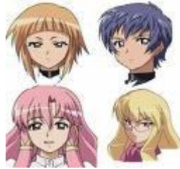
Figura 12 16 Tipos de cabello en personajes de anime

Cabello de colores: El cabello de los personajes es de colores diferentes para lograr una mayor diferenciación de los mismos. También es dibujado de varias formas, desarrollando nuevos peinados (ver figura 12).