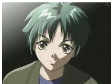
Figura 19. 26 Suguro Fujisaki de la serie Gravitation

Suguru Fujisaki: es el tercer miembro de la agrupación Bad Luck, y se ocupa del teclado. Es muy serio y reservado, pero a la vez, es uno de los mejores en su profesión, lo que lo convierte en una pieza clave de la banda (ver figura 19).