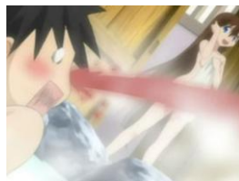
Figura 13c 19 Clásica expresión de “excitación” en el anime