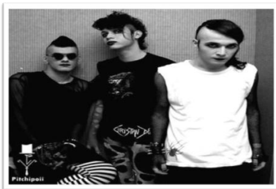
Ilustración 4.9: Provenientes de la ciudad de Cali, e inactivos hoy día, la agrupación Pithipoi es aclamada como la primera banda Deathrock del país por el público capitalino.