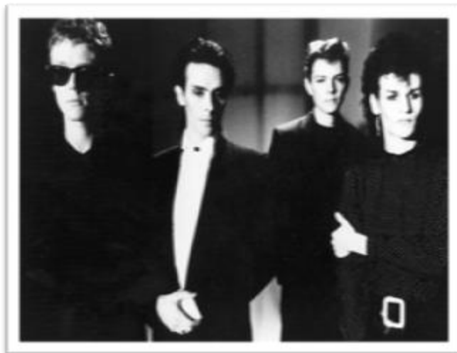
Ilustración 3.6: Bauhaus. Inspirados por la literatura vampírica, desarrollan un estilo musical sombrío y experimental.

The Damned es una agrupación británica formada en Londres, también considerados pioneros tanto del Post-Punk como del Rock Gótico, se denominan en su website oficial como una banda de Psychodelic Punk . El look