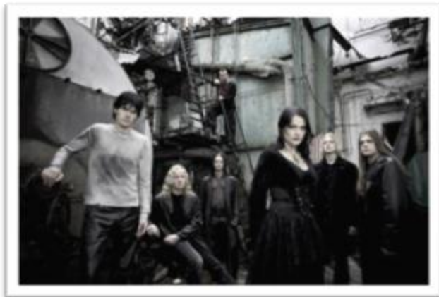
Ilustración 3.18: Tristania en el 2004, justo antes de que su destacada vocalista dejara la banda. Su estética sugiere contrastes entre lo clásico, los vestidos victorianos y las vestimentas modernas del Metal.

London After Midnight es una agrupación norteamericana que tomó su nombre de la película muda dirigida por Tod Browning en el año de 1927. Según ellos no les gusta catalogarse únicamente como góticos ya que esto causa división en las personas y sus gustos, además de limitar con etiquetas la capacidad creativa del artista ( London After Midnight Website: History and discography , 2009). Son una de las bandas que quieren