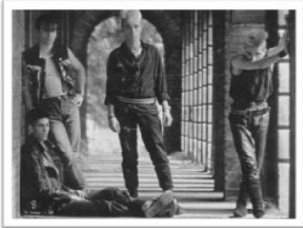
Ilustración 3.9: Sex Gang Children en sus primeros años.