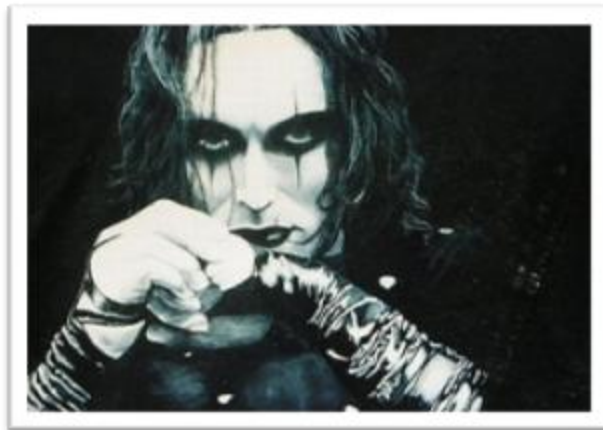
Ilustración 2.6: Brandon Lee interpretando a Eric Draven, luciendo maquillaje pálido y delineador de ojos negro.

presenta una ciudad completamente oscura con dos escenas de día en toda la película; el resto es desarrollado de noche y en interiores.