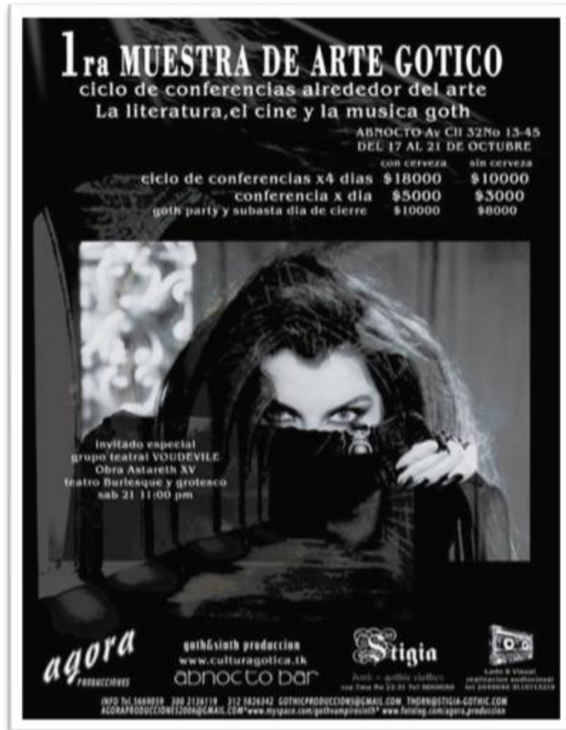
Ilustración 4.6: Primera muestra de arte gótico den Bogotá, gestionado por Alianza Gótica Bogotá en asociación con Stigia, Abnocto bar y otros colectivos artísticos cercanos. Esta muestra promocional fue difundida en correos electrónicos durante el mes de octubre de 2006, y la conservo desde ese entonces por su excelente diseño. En el evento hubo poesía, teatro, fotografía, escultura, recitales literarios y conferencias de temas relacionados con la estética gótica contemporánea.

Junto al relato audiovisual encontramos la fotografía que ilustra relatos visuales con luz y proporciona mejores elementos para la construcción de opiniones a partir de las obras. La sensibilidad que proporciona la fotografía es percibida en tiempo real, es decir, al apreciar una fotografía percibimos el mundo como realmente es y como lo vemos en nuestra vida diaria, provocando una reacción sensorial lo más familiar posible con lo natural y humano. El momento que se plasma en la fotografía vive realmente.