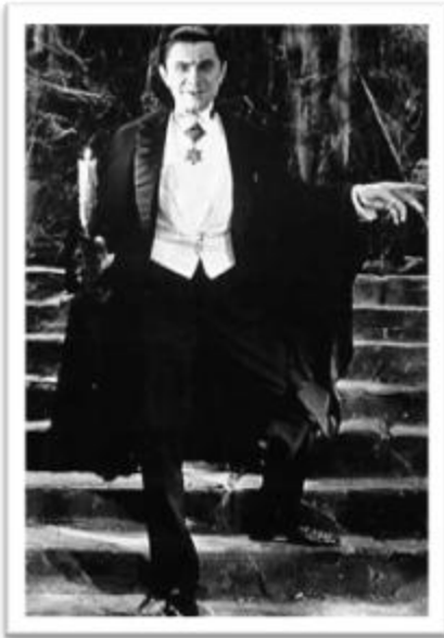
Ilustración 2.4: Drácula, interpretado por el actor Húngaro Bela Lugosi.

Lugosi, figura inmortal del terror en el cine e inspirador del tema “Bela Lugosi’s Dead” de una de las agrupaciones pioneras del Rock Gótico, Bauhaus de Inglaterra 29