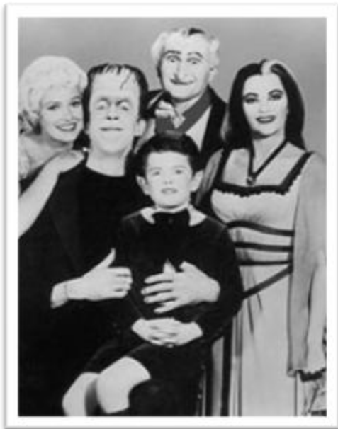
Ilustración 2.2: Los Munsters.

El auge del drama radiofónico llegó a su fin en la década de los cincuenta, cuando la televisión empezó a tomar ventaja. Como herencia del cine expresionista alemán, la televisión de la época tiene que invertir mucho más dinero en efectos y maquillaje que los seriados radiofónicos (al que le bastan ciertos elementos y un máster de emisión). Los seriados radiofónicos que abordamos anteriormente fueron llevados a la pantalla grande sin éxito, y no es nada extraño que hasta el mismo Raymond Johnson “prefiriera quedarse fuera del tiro de la pantalla (Badeley, 2007, p. 148). De esta manera, lo poco que queda del arte del drama radiofónico decae