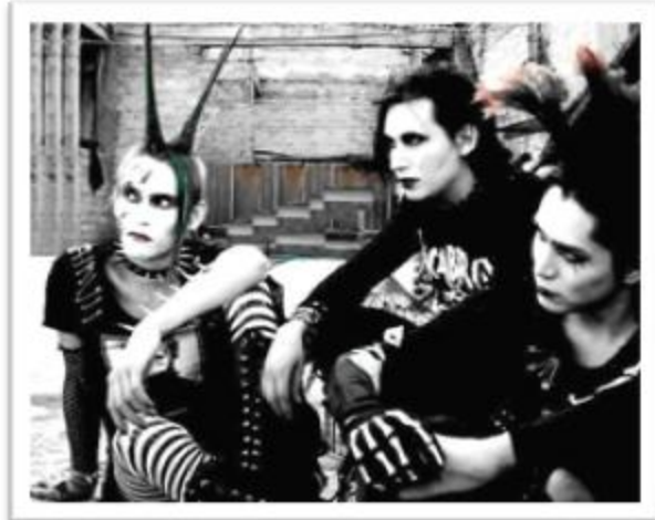
Ilustración 3.25: Estética y musicalmente, los Gorgonas reviven el Deathrock en toda su expresión.

consolidarse como Hocico a mediados de los noventa, y este nuevo milenio fue su mejor época a nivel mundial, logrando participar en festivales como Wave Gotik Treffen acompañando de giras a nivel mundial.