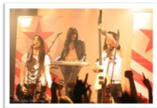
Ilustración 3.24: Dopestars Inc y su nueva cara del Cyberpunk. El ensamble que usa la banda es el resultado de la mezcla de lo acústico eléctrico a lo electrónico, es decir, de lo tradicional a lo vanguardista, común denominador en esta década.

DopeStars Inc revive la mezcla de Punk y tecnología que gestionó Billy Idol dos décadas atrás. Comienza en Italia su carrera artística como una banda de Rock Industrial, y poco a poco desarrolla un estilo Cyberpunk gracias al