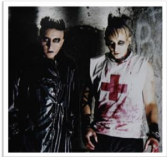
Ilustración 3.26: Gracias a Hocico la música electrónica alterna latina es conocida en el mundo.

Hocico no es revival , pero si los pioneros del Terror EBM en Latinoamérica. Es la única banda latina de este género que ha llevado su música a los festivales más importantes a nivel mundial. Su amplia trayectoria artística va desde 1989, pasando por varios cambios en su alineación y nombre hasta