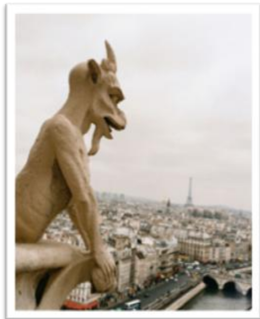
Ilustración 2.1: Una de las gárgolas de la catedral de Notre Dame mirando las calles de Paris.

La catedral gótica es el centro de atracción en la edad media, que reunía a alquimistas para hablar de sus estudios, a enfermos para suplicar en sus muros por su curación hasta lograrla; y gentes de la época, concibiéndose así como una gran enciclopedia. Quizá el arquitecto de la época no date el por qué y cómo de su obra de arte, pero si hablan por si mismas la cantidad de figuras que se contemplan en estas construcciones como vampiros, dragones, gárgolas y tarascas, son el “guardian secular de la obra ancestral”