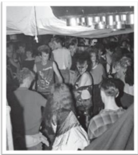
Ilustración 3.7: The Batcave, en Londres.

Throbbing Gristle es la agrupación creadora (accidentalmente) del Industrial gracias al nombre de su sello disquero, Industrial Records, y la extraña música sobrecargada de efectos y atonalidades. Experimentan con efectos de sonido primarios para guitarras y voz, manteniendo una percusión plana, suave y atmosférica que inspira un trance sonoro.