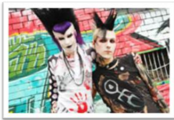
Ilustración 3.23: All Gone Dead revive en el siglo XXI la estética DeathRock de la época de Christian Death y afirma la importancia del Post-Punk como subgénero y herencia musical.

mezclada. Uno de los proyectos alternos de uno de sus integrantes antes de All Gone Dead era Tragick Black, proyecto de Cyberpunk . uso constante de sintetizadores como melodía y fuertes armonías con guitarras eléctricas distorsionadas, resultando un Punk electrónico con tintes Industrial .