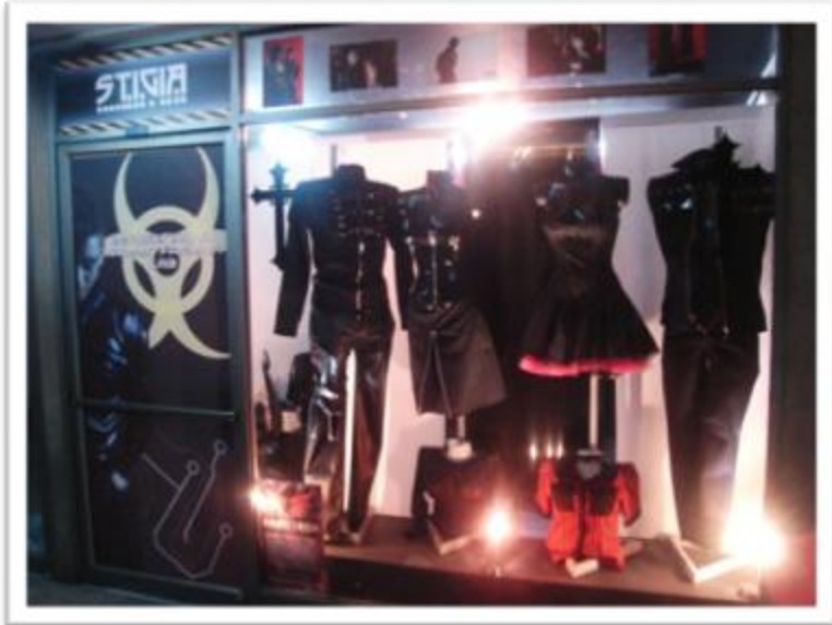
Ilustración 4.3: fachada de la tienda Stigia, en el centro de la ciudad. Tomado de

http://www.facebook.com/djtimeord?v=feed&story_fbid=251938264997#/pages/stigia/57352459718?v=info .