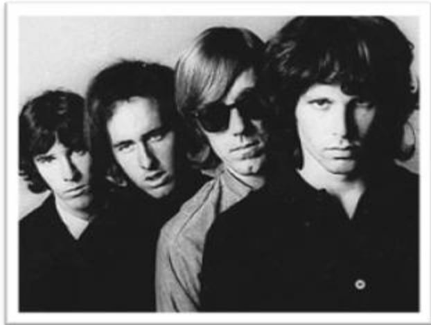
Ilustración 2.4: The Doors.

cosas contra la guerra del Vietnam, contra el Presidente, contra la administración...” (Sierra, 1978, p.14). Si escuchamos la música de Dylan de sus primeros años (justo antes de su transición de lo acústico a lo eléctrico ), tendremos en algunas piezas sonoridades melancólicas, cantos profundos y tempo lento 20 ; rasgos que