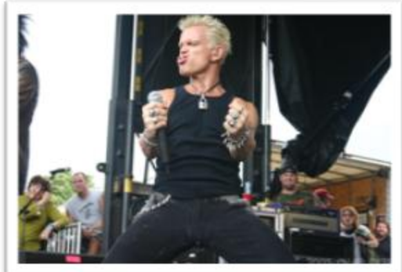
Ilustración 3.4: Billy Idol durante su Van Warped Tour en Minneapolis en el 2005, siempre con actitud y estética Punk, es aún uno de los pioneros más reconocidos del subgénero.

Billy Idol : solista británico que, también del Bromley Contingent , forma su primera banda Generation X en el 1976 sin éxito comercial, aunque de esta banda saldría uno de sus éxitos más reconocidos, Dancing with myself . Su carrera en solitario tuvo éxito (siempre con la actitud Punk) durante la década posterior, y lo llevará a los