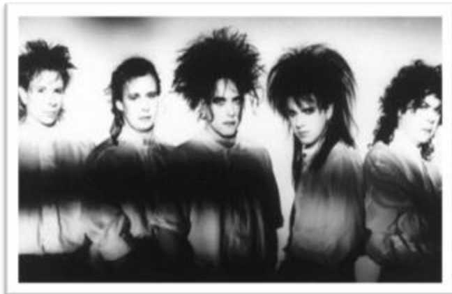
Ilustración 3.3: The Cure. Cada integrante tiene su propia estética, sin dejar atrás los peinados erizados típicos del Punk y maquillaje recargado y oscuro en los ojos.

el libro de Albert Camus The Stranger . Su estética es una fuerte influencia para los góticos. Asimismo, Robert niega que su banda sea gótica, asegurando que su música es un estilo independiente que desarrolló la banda a partir del Post-Punk y por su estilo único, no puede ser catalogada como Rock Gótico