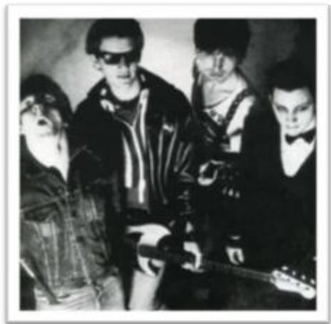
Ilustración 3.5: The Damned y su vocalista con look similar al arquetipo del Conde Drácula.

de su vocalista y su posterior giro musical hacia las sonoridades oscuras, serían los responsables de la etiqueta gótica para esta banda.