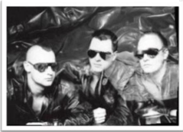
Ilustración 3.14: Front 242, grandes pioneros de la música electrónica alternativa, con look propio del Post-Punk.

Suicide Commando , inspirada por la anterior, es una de las agrupaciones pioneras del estilo Dark Electro , Hellectro y Aggrotech . Combina en una electrónica densa atmósferas del EBM con voces distorsionadas y