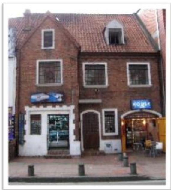
Ilustración 4.2: Fachada del Centro Cultural Tres Cruces Industrial, a la altura de la carrera Séptima con calle 55.