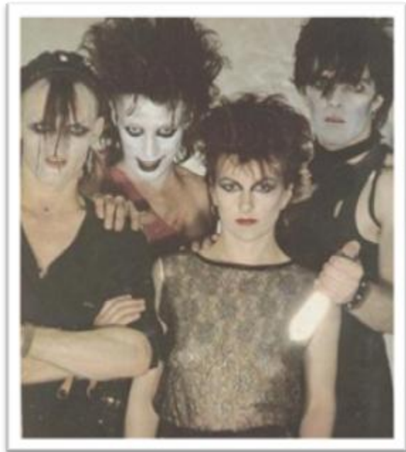
Ilustración 3.8: Alien Sex Fiend en su alienación original. Se puede apreciar la influencia del cine expresionista alemán, el Post-Punk y la ropa sadomasoquista entremezclados en un solo acto musical.

Sex Gang Children es una agrupación Londinense que define el uso del término gótico para describir a “aquellos jóvenes fans de los Banshees que vivían en las Visigoth Towers” ( Sex Gang Children on Myspace music , 2009). Emergen a principios de la década reconocidos por su participación en el Batcave , y con su composición musical cargada de percusión tribal, voz dramática y violines (en algunas ocasiones) influyen a la vertiente Dark Cabaret en la década siguiente.