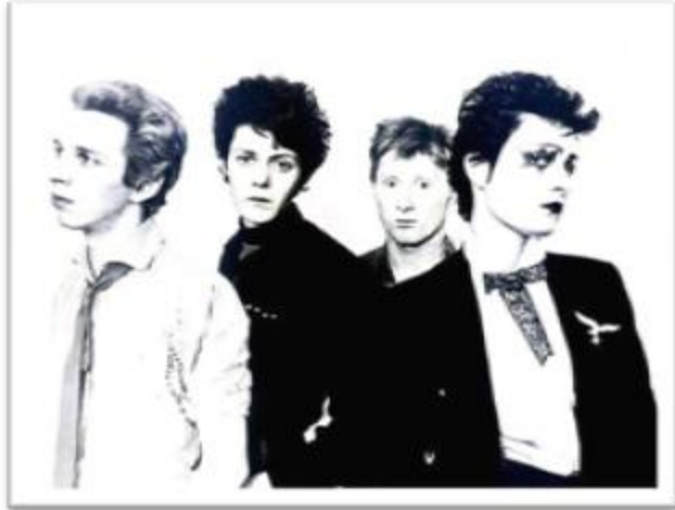
Ilustración 3.2: Siouxsie and the Banshees hacia el año 1977. Como se puede apreciar, Siouxsie era la única de la banda que acostumbraba a maquillarse de tonos oscuros y extravagantes.

Siouxsie and the Banshees es una agrupación Punk londinense, en la que miembros de agrupaciones como The Cure, The Creatures y Adam & the Ants son sus exintengrantes. La apariencia y la voz de Siouxsie Sioux en escena inspira la figura gótica femenina, que a su vez nos remite a la estética de personajes femeninos del cine expresionista alemán y Morticia , protagonista del seriado norteamericano Los Locos Addams . El término banshee hace parte del