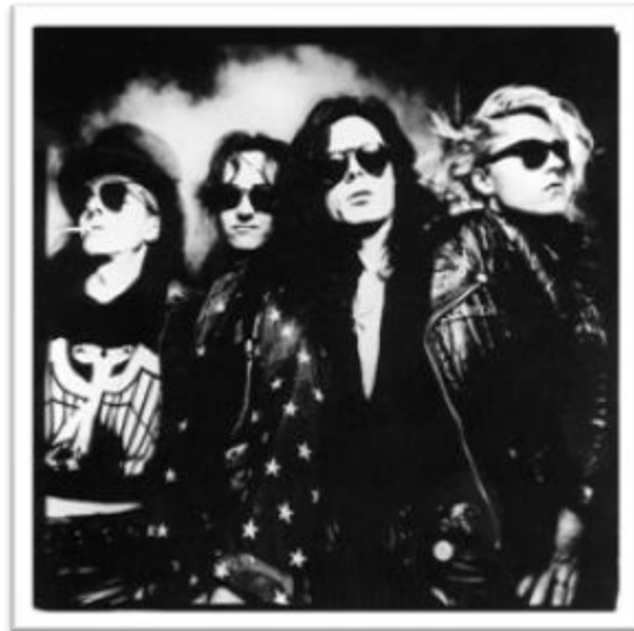
Ilustración 3.10: The Sisters of Mercy, comienzan su exitosa carrera en 1980, concretando el tono barítono que definirá el sonido del Rock Gótico. Tomado de

Christian Death se forma en Los Angeles en el año de 1979, mientras que en Inglaterra la onda siniestra se define como gótica. Si en Londres tenemos a la música Batcave (nombrada así por ser interpretada en el bar Batcave ), su equivalente en