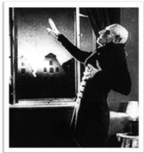
Ilustración 2.5: recuadro de Nosferatu en el que el Conde Orlok sufre por la luz del amanecer. Tomado de http://dearjesus.wordpress.com/page/2/ .

En la misma época se estrenó el clásico Nosferatu (1922) del director alemán F.W. Murnau, la pionera del arquetipo del vampiro. Esta película muestra la relación entre amor y horror encarnado en el Conde Orlok y Ellen, sus personajes principales, quien es la única tiene el poder para acabar con el vampiro. Nueve años después la figura monstruosa del Conde Orlok es superada por la elegancia y seducción del Conde Drácula, quien es llevado al cine por el director Tod Browning y encarnado por Bela