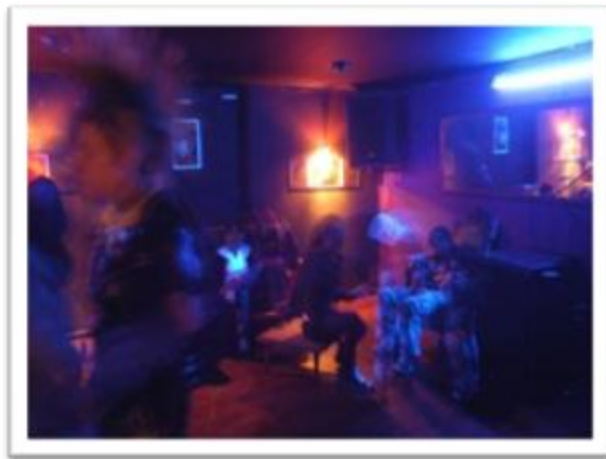
Ilustración 4.1: Abnocto bar en su segunda ubicación en el centro de la ciudad. Esta fotografía fue tomada para un artículo del periódico El Tiempo en el que se posiciona al bar como el recomendado de fiestas alternativas, durante el año que trabajé en el bar.

El primer escenario donde sucedieron las fiestas góticas fue el Café del Gato Bardo , ubicado en la Carrera 17 #72-28 en sus años de existencia. Es un lugar pensado para disfrutar el Rock de culto como el Surf, Rockabilly, Garage, New Wave, Horror Punk y