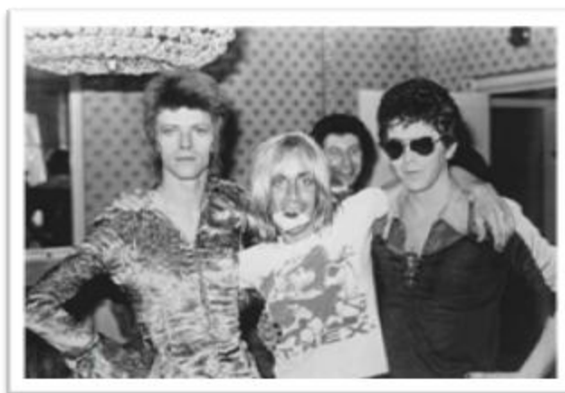
Ilustración 2.5: Las figuras del movimiento Protopunk. De izquierda a derecha: David Bowie, Iggy Pop (que luce una camiseta de la agrupación T-Rex) y Lou Reed de The Velvet Underground.

Década donde el Rock llega a sus puntos más altos como género; época en que nacen las semillas de la década anterior. El Rock que en los sesenta llegó a su cúspide de oro con el movimiento Hippie decae en la transición del año de 1969 al 1970, es decir, la gloria de los sesenta culmina con la vida de