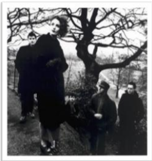
Ilustración 3.12: Clan of Xymox fue apadrinada por uno de los sellos más populares de la música alternativa, 4AD Records, quien trabajó con agrupaciones como The Pixies y Cocteau Twins. Hoy completan casi 30 años de trayectoria artística con varias giras mundiales.

Dead can Dance es una agrupación australiana formada en Melbourne en el