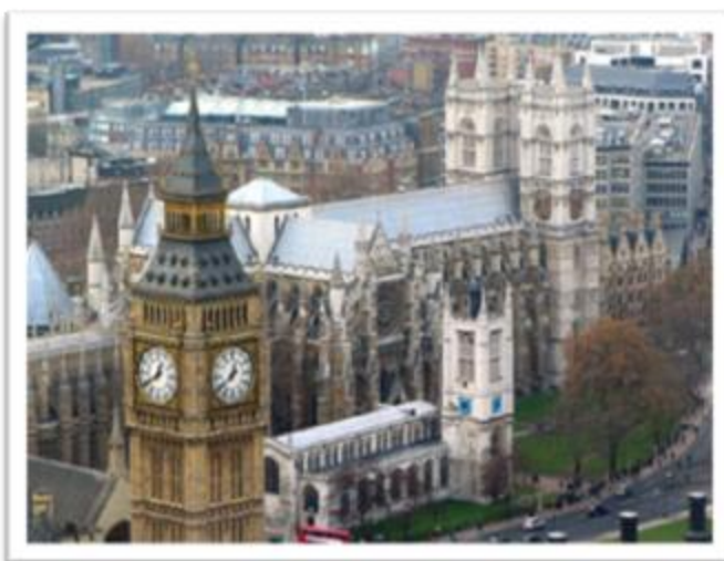
Ilustración 2.2: La abadía de Westminster y las Casas del Parlamento Británico en la ciudad de Londres. Una muestra de la arquitectura gótica clásica (Westminster) y su renacimiento en el siglo XIX (Big Ben).

Badeley en su Guía para la cultura oscura , asegura que hay relación entre el arte gótico medieval y la iconografía gótica actual como grabados que tratan sobre muerte, lujuria, danza macabra de cadáveres y gárgolas en las catedrales más reconocidas, es decir, toda una iconografía profana y misteriosa en el cual sólo sus creadores saben su significado (Badeley, 2007, p.16). Concluye su punto vista asegurando “Las