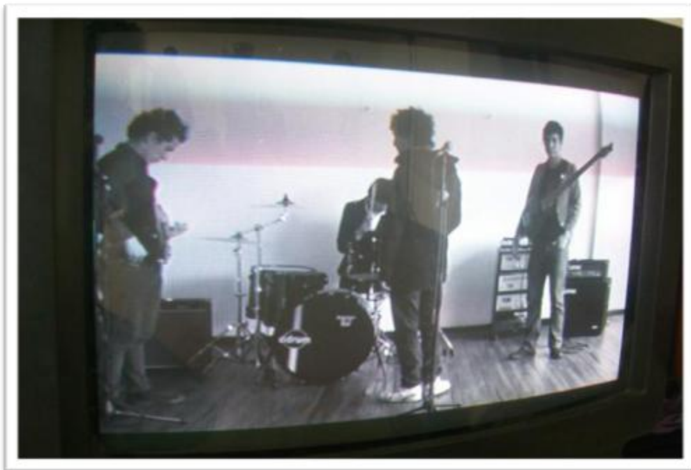
Ilustración 4.12: The Radio Flyer es una de las agrupaciones Post-Punk/Garage más reconocidas de la capital actualmente, después de haberse presentado en ciudades como Medellín, Manizales y Cali. En sus fotografías se evidencia la influencia estética de grupos como Joy Division, y Sonic Youth (quienes interpretan No Wave) en su música. Tomado de http://www.myspace.com/theradioflyerbogota .

No pertenecen a la escena , sólo logran involucrarse los que se inclinan por el Post-Punk de tinte oscuro. Son jóvenes que gustan del Rock Alternativo e Independiente, el Punk Rock (incluyendo al Post-Punk), música electrónica, New Wave y Electroclash con