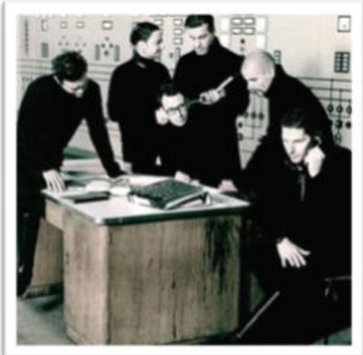
Ilustración 3.19: Rammstein ha usado varias estéticas a través de su carrera, haciéndolos imposibles de clasificar en una sola. Su influencia en la música es importante ya que gracias a ellos el género Industrial es conocido en todo el mundo.

a los premios Grammy tras haber posicionado sencillos como “Du Hast” en los primeros lugares de las listas.