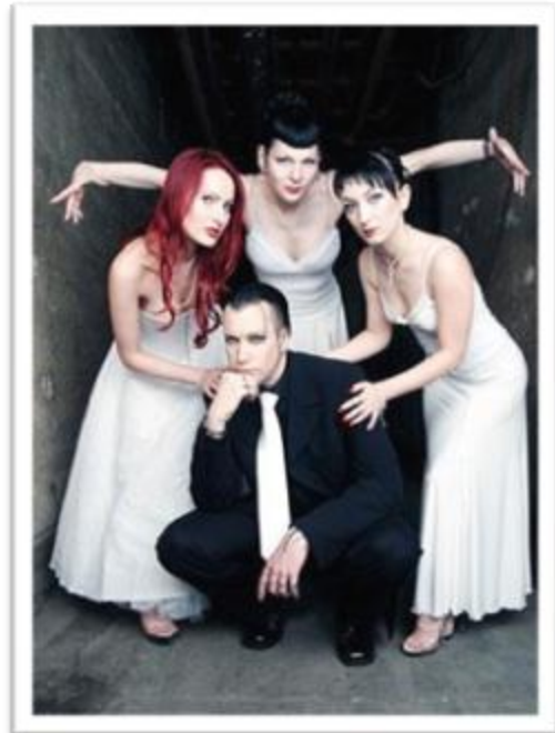
Ilustración 3.20: Chris Poll siempre contrasta lo clásico y vampírico con lo moderno junto a sus integrantes.

Rammstein es responsable de dar a conocer el Industrial Metal a nivel mundial. Nace en el año de 1994 en Alemania, y a diferencia de Throbbing Gristle , su música no contiene experimentación atonal sino una clara instrumentación de Rock con acompañamiento de secuencias digitales, sintetizadores y efectos modernos. Han vendido más de 12 millones de discos en el mundo, siendo nominados en dos ocasiones