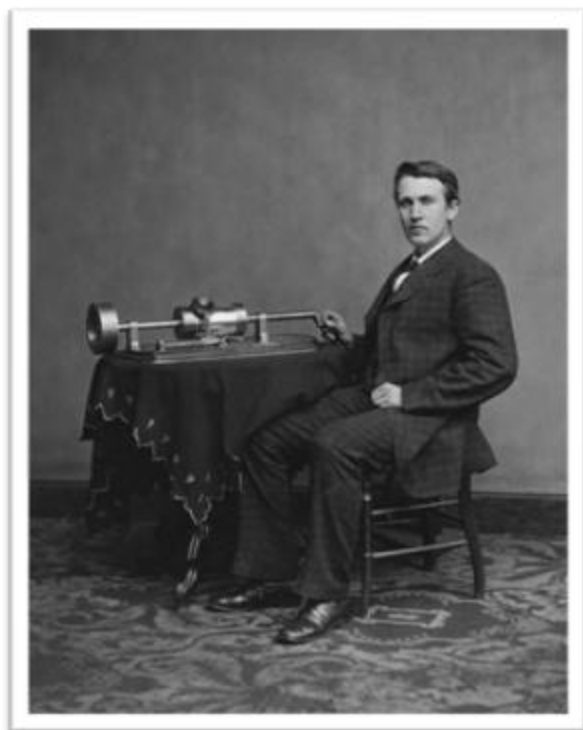
Ilustración 2.7: Thomas Alba Edison y su fonógrafo. Tomado de http://eltamiz.com/2008/01/31/inventos-ingeniosos-el-fonografo/ .

La primera revolución en la forma de escuchar música llegó con la aparición del cassette y posteriormente el dispositivo portátil de reproducción mundialmente conocido como Walkman . Es el primer reproductor portátil en ofrecer funcionamiento sin necesidad de conexión directa a corriente eléctrica (reemplazada por baterías pequeñas). En la última década del segundo milenio, el disco compacto entró al mercado, sorprendiendo al oyente con su asombrosa calidad de audio (esta vez sin ruido