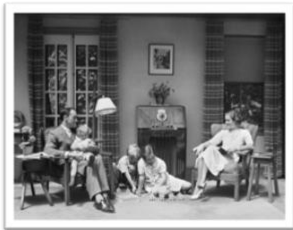
Ilustración 2.1: Familia antigua escuchando una emisión de radio. Tomado de http://album-agujero-negro.blogspot.com/2009/02/despues-llego-la-tv.html .

evolutivamente. El 8 de septiembre del pasado 2007 fue asesinado Julián Prieto, guitarrista de la agrupación bogotana de Hardcore, Pitbull, a mano de un grupo armado de Skinheads o “cabezas rapadas”, como la prensa local los llamó (El Tiempo, 2007). Desde este y otros incidentes relacionados con tribus urbanas , la atención de la comunidad bogotana hacia sus jóvenes ha incrementado con cada hecho similar que se presenta, resultando una gama muy amplia de opiniones y sentimientos reflejados en los medios de comunicación; basta acercarse a una noticia de este corte en línea y leer los comentarios que publican los foristas que acceden al artículo, video, etc. Fue tan controversial el hecho que decidí observar atentamente, y día a día, el desarrollo de la noticia en los medios hasta que el hecho calló en el olvido con la captura del asesino (El Tiempo, 2008). Fue una tarea interesante, ya que comparé varios artículos de prensa y segmentos de noticieros y encontré hechos curiosos como ver la puesta en escena de los