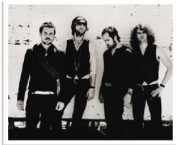
Ilustración 3.22: The Killers no incluye alguna estética particular, y su música tiene tintes experimentales y Post-Punk que ahora son conocidos por las nuevas generaciones, y por ende el subgénero adquiere un valor más especial hoy día.