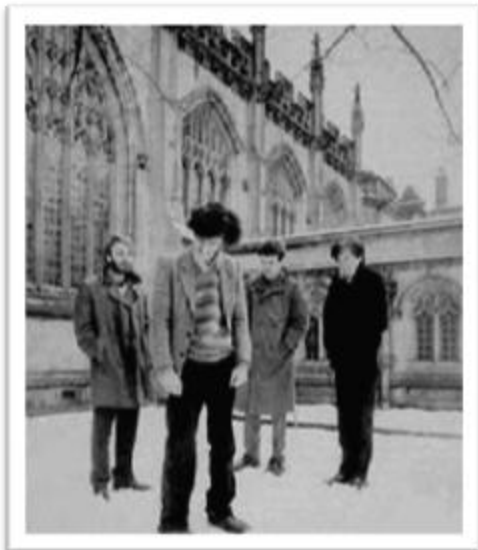
Ilustración 3.1: Joy Division junto a una catedral de estilo gótico en la ciudad de Manchester, Inglaterra. Sesión de fotos por Anton Corbijn quien más de dos décadas después rodaría el largometraje Control sobre la vida de Ian Curtis.