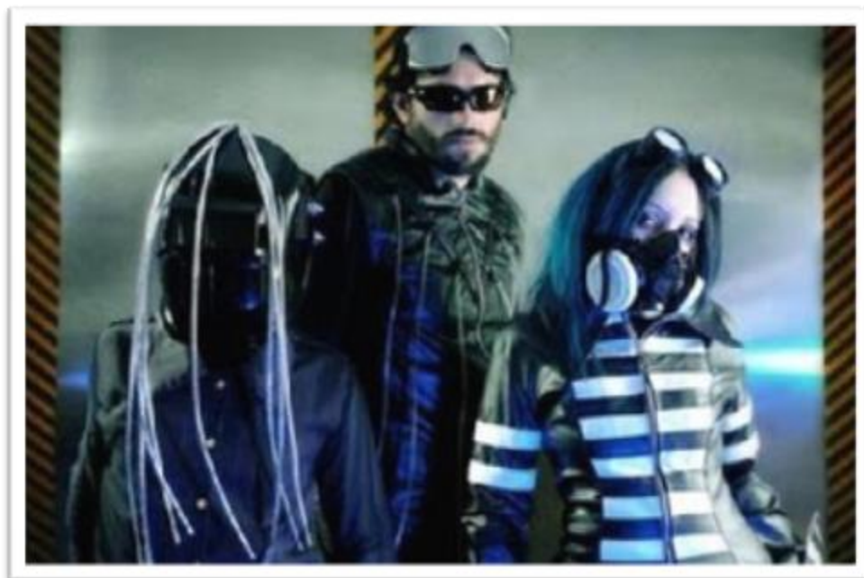
Ilustración 4.8: Psyborg Corp trabaja con temáticas futuristas y lo expresa con su estética en vivo, mezclando también temática Industrial con máscaras de oxígeno y elementos de protección industrial.

Son la “comunidad musical electrónica” del gótico que baila al ritmo del EBM, Electro-Goth, FuturePop y Aggrotech. Su tendencia futurista integra elementos del Industrial en su estética y música como herencia directa también de la tradición de la música electrónica mundial en la que los Disk Jockey’s y los clubes son los más reconocidos. Escuchan tendencias desde el EBM Old School como Front 242 hasta sus últimas tendencias mezcladas con FuturePop o Aggroterch. Constituyen un buen porcentaje de los góticos en Bogotá.