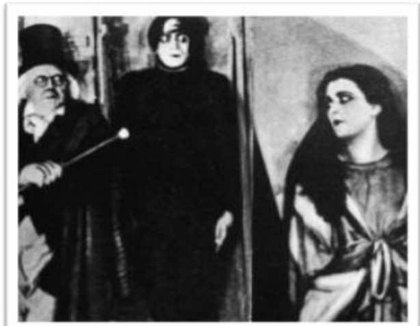
Ilustración 2.3: Recuadro de Des Kabinett des Dr. Caligari donde se puede apreciar la estética usada por el cine expresionista alemán.

El expresionismo alemán es una tendencia artística que surge en la época contemplada entre 1918 y 1933 (justo cuando Adolf Hitler asciende al poder) teniendo como inspiración el diario vivir alemán de aquellos días. En esta época el cine alemán explota todo su potencial en cuanto a escenario, iluminación, decoración y toda su técnica