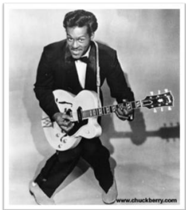
Ilustración 2.3: Chuck Berry, uno de los artistas más populares de la década de 1950. Tomado de http://www.chuckberry.com .

Hablando de Rock n' Roll, nos remitimos a la problemática racista a comienzos del siglo XX, donde las tendencias musicales se dividieron en razas principalmente. Por un lado tenemos el Country de los blancos y el Jazz y Blues de los negros, cada uno generando su propio estilo de ejecución instrumental, raíces del Rock n' Roll; lo que va a marcar esta tendencia definitivamente es la transición de lo acústico a lo electrónico, es decir, de la guitarra acústica a la guitarra eléctrica y con esto el inicio de la Industria