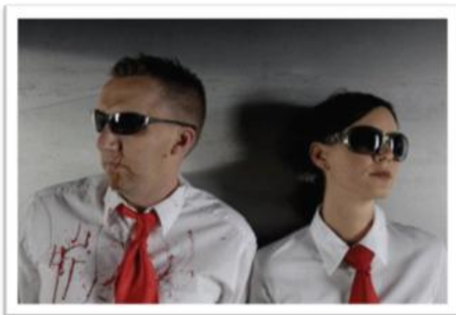
Ilustración 3.15: Suicide Commando con su estética sugiere sangre, industria, sensualidad y tecnología.

la alineación tradicional del Rock: un dúo conformado por vocalista y