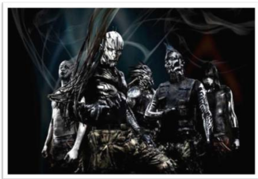
Ilustración 4.7: Koyi K Utho, agrupación reconocida a nivel internacional por colaboración de profesionales que han trabajado con bandas importantes del género como Nine Inch Nails.

No se consideran góticos, pero si les agrada lo que tenga que ver con su estética. El Industrial viste colores militares mezclados con artículos futuristas en algunos casos, y en otros comparte el negro que tanto usan los góticos, caracterizándose por ser un