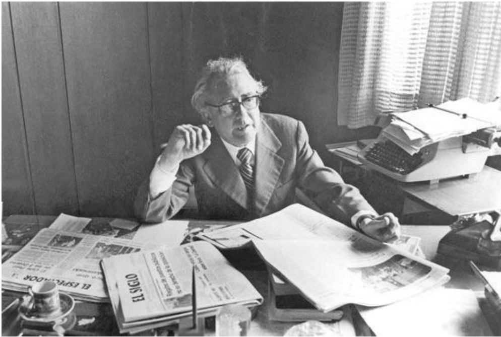
Imagen # 8 (Atentado El Espectador)