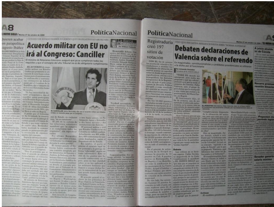
Imagen # 20 (diario El Nuevo Siglo)