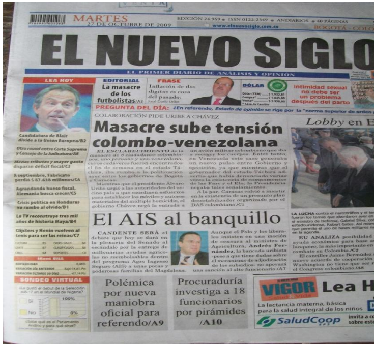
Imagen # 18 (diario El Nuevo Siglo)