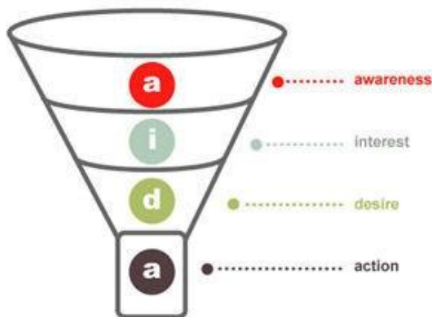
Gráfica Nº1.

Como ya se dijo anteriormente, los activistas, especialmente los que siguen el activismo práctico, han conseguido incorporar distintas ciencias a su conocimiento como es el caso de la publicidad o el mercadeo; uno de los modelos más utilizados es el AIDA (Acción, Interés, Deseo, Acción). Implementando esta estructura en las campañas animalistas muchas organizaciones han logrado obtener mayores beneficios.