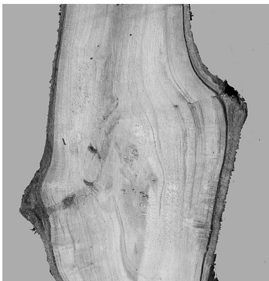
Figure 3. Sección longitudinal del cultivar "Burlat" injertado sobre "Monrepós". La unión presentó buena continuidad de la corteza y madera 5 años después del injerto.

Figure 3. Longitudinal section of the Cherry cultivar "Burlat" grafted on "Monrepós". The graft union showed good continuity in the bark and wood tissues 5 years after grafting.