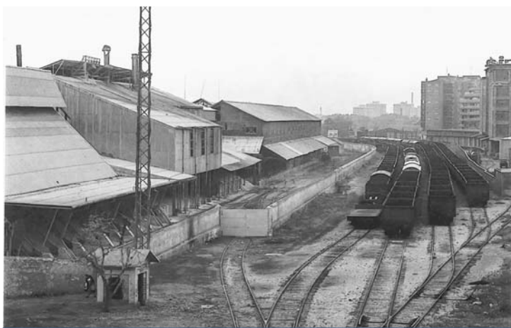
Barrio de La Almozara-La química, Mediosos S XX