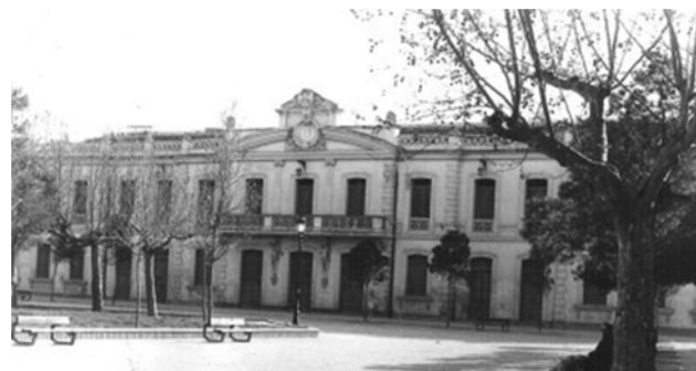
Estación de Utrillas

Aparte del cultivo de la remolacha, los avances logrados en la Granja-Escuela en forrajes, cereales, vid, tabaco y algodón, avivan la implantación de la naciente industria de maquinaria destinada a la agricultura: aperos, prensas para aceite y vino, separadores de semillas, segadoras, pulverizadores, telas metálicas, etc.