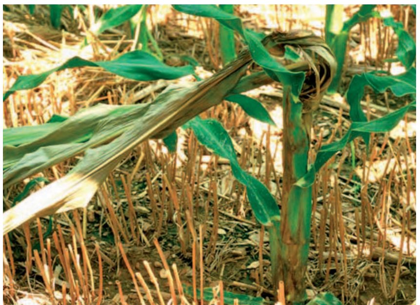
FOTO 1. Podredumbre del tallo en planta de maíz en campo infectada por Dickeya spp.

En nuestro laboratorio, hemos desarrollado un nuevo método para la realización de análisis bioquímicos y fisiológicos de Dickeya spp. mediante un sistema de microplacas, que permite el análisis simultáneo de un elevado número de muestras y resulta