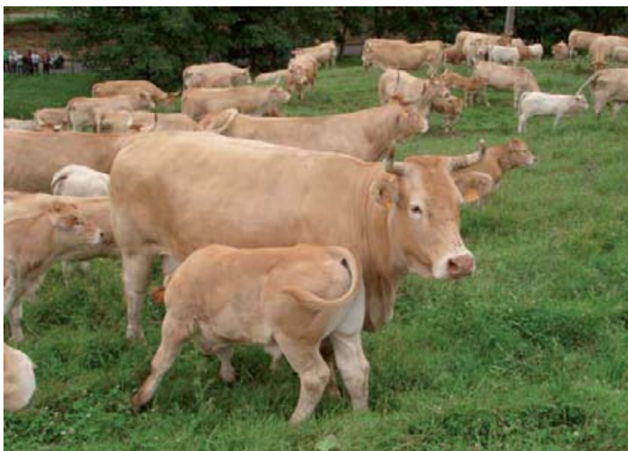
Arriba: toro de raza Limousin. Abajo: rebaño de vacas Pirenaicas.

Se está desarrollando en la actualidad un proyecto que pretende determinar qué consecuencias tienen los niveles alimenticios que reciben las novillas desde su nacimiento hasta la primera cubrición o inseminación sobre sus rendimientos como animal adulto (Casasús et al , 2010; Rodríguez-Sánchez et al , 2013a). Entre otros resultados, este trabajo permitirá conocer la viabilidad técnica de adelantar la edad al primer parto en vacuno de carne a los 24 meses de edad. En este sentido, es necesario remarcar la necesidad de evitar las cubriciones anterior-