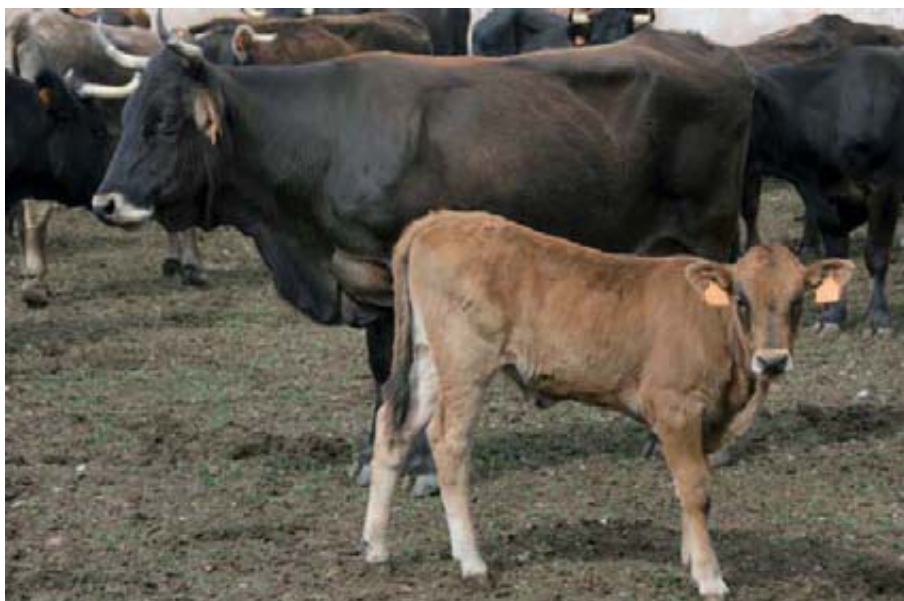
Vaca y ternero de raza Serrana de Teruel.

“ La mejora de la eficiencia reproductiva debería ser prioritaria para ganaderos, productores, veterinarios y técnicos ”