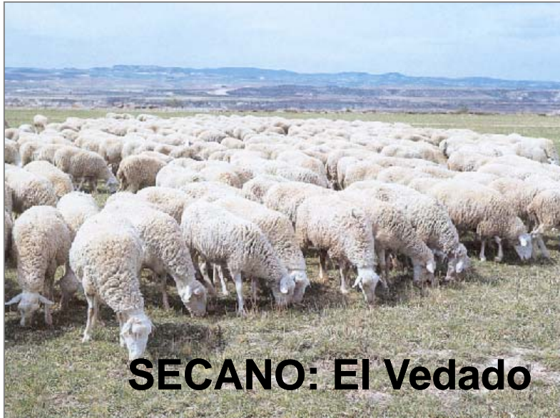
SECANO: El Vedado