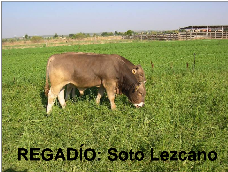
REGADÍO: Soto Lezcano