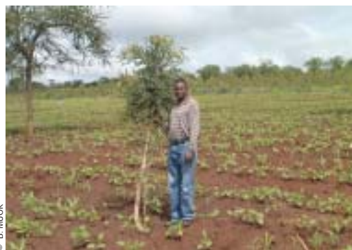
Arbre d'un an maintenu sur des terres cultivées.

En Afrique australe, la variation entre les arbres est bien connue par les agriculteurs locaux. Dans la province du Limpopo (Afrique du Sud), par exemple, les Pédis reconnaissent trois variétés de pruniers d'Afrique en fonction du parfum et de la sa-