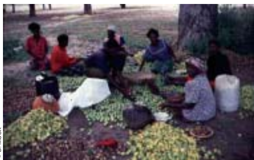
Transformation de fruits de prunier d'Afrique après cueillette.

Le prunier d'Afrique est un arbre fruitier de grande valeur et toutes les parties du fruit sont comestibles, crues ou cuites. Les fruits sont mûrs une fois devenus jaunes. À ce stade, ils ont déjà subi une abscission et sont donc généralement ramassés par terre. Les fruits et les amandes sont une composante importante du régime des populations rurales. Les fruits frais sont largement consommés, en particulier par les enfants, et constituent une riche source de vitamine C. Ils sont également cueillis et transformés pour fabriquer du jus, des boissons alcoolisées (vin et bière) et de la confiture. L'amande est écrasée