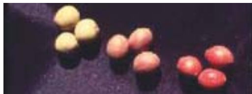
Différences de couleur des fruits.

Une forte variation morphologique a été observée entre les populations de prunier d'Afrique du Kenya et en leur sein, mais il est maintenant reconnu que cette variation se présentait au niveau des sous-espèces. Cette variation concerne notamment la taille et la forme de la feuille, la taille du fruit, le poids de l'amande et de la coque, ainsi que leurs couleur, goût et forme générale.