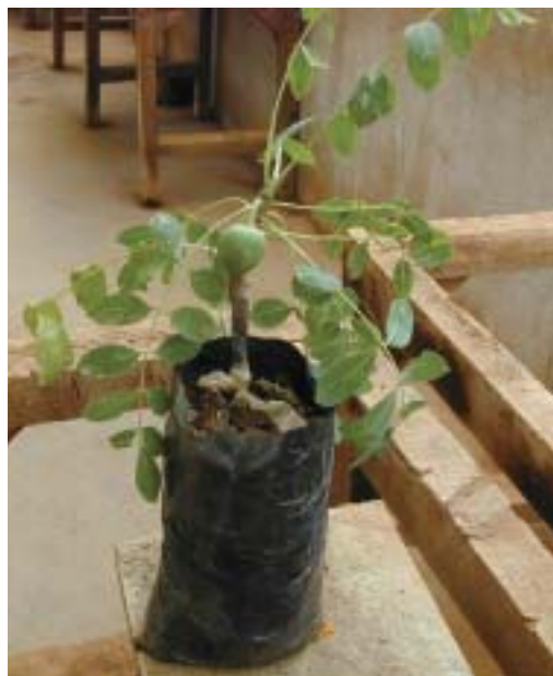
Jeunes plantes de prunier d'Afrique.