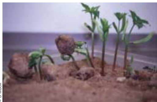
Émergence des plantules.

Les populations de prunier d'Afrique comprennent principalement des arbres qui sont maintenus dans les champs. Les rares tentatives visant à produire de jeunes plants de prunier d'Afrique en pépinière se sont heurtées à certains problèmes, notamment aux faibles taux de germination. La multiplication à partir des graines nécessite plusieurs étapes permettant d'interrompre la dormance et de garantir un bon taux de germination (voir ci-après). Stocker les graines pendant une ou plusieurs années peut également accroître le taux de germination. La germination prend deux à quatre semaines et, dans de bonnes conditions, des taux de 100 % peuvent être obtenus. Les tiges doivent atteindre la hauteur du genou avant que les jeunes plants