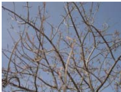
Floraison de Sclerocarya birrea .

Le prunier d'Afrique est généralement dioïque : les fleurs mâles et femelles sont situées sur des arbres distincts. Bien que les fleurs soient généralement d'un sexe ou de l'autre, il arrive que certaines soient à la fois mâles et femelles. Les fleurs du prunier d'Afrique, bien que dépourvues de parfum, sont très attrayantes pour les abeilles et d'autres insectes, notamment les mouches, les syrphes et, plus rarement, les guêpes. Il semble que ces insectes en soient les principaux pollinisateurs.