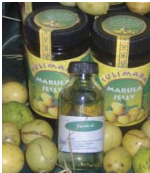
Gelée et huile issues du prunier d'Afrique.

pour en extraire la graine. Celle-ci est ensuite pressée pour obtenir de l'huile, qui peut être utilisée pour la consommation ou dans l'industrie cosmétique. L'endocarpe huileux et comestible est occasionnellement vendu sur les marchés locaux et contient jusqu'à 6 % d'huile.