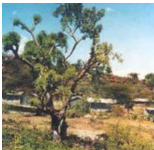
Branches de prunier d'Afrique coupées pour obtenir du fourrage dans le district de Baringo (Kenya).

On considère qu'il est peu probable que la cueillette des fruits du prunier d'Afrique constitue un risque direct pour l'espèce, compte tenu du grand nombre de fruits produits par chaque arbre. On estime que 92 % des fruits peuvent être récoltés sans réduire la régénération. Les impacts de la collecte de l'écorce pour fabriquer des médicaments et du bois pour la sculpture et le combustible varient en fonction de la fréquence, de l'intensité et de l'ampleur de la récolte, aussi bien au niveau de chaque arbre que de la population dans son ensemble. Ces formes d'utilisation des ressources du prunier d'Afrique doivent être contrôlées pour en limiter les impacts négatifs.