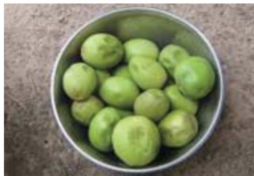
Fruits destinés à la consommation.

Le beurre de karité présente d'importantes propriétés thérapeutiques, en particulier dermatologiques. Il protège contre les rayons ultraviolets (UV) et a des propriétés hydratantes, régénératrices et anti-rides. Il est également utilisé dans des