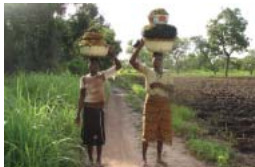
Fillettes cueillant des fruits pour les transformer en beurre de karité.

Les pressions humaines, notamment l'abatage d'arbres pour le bois de feu, les feux de savane et de brousse et le déboisement des forêts au