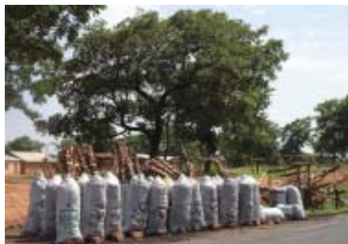
Vente de charbon dans le nord du Bénin.