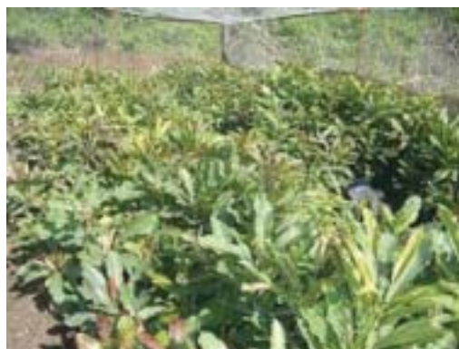
Jeunes plants en pépinière à la station de recherche de Sotouba (Bamako).

Les agriculteurs ne plantent généralement pas de karités, il y a donc peu d'expérience locale en matière de production de jeunes plants. La graine est récalcitrante et ne peut donc pas être stockée selon des méthodes classiques. Le taux de germination décroît considérablement au bout de trois semaines de stockage à température ambiante (30 à 35 °C). Le temps de germination varie de sept jours à trois mois. Dans de bonnes conditions, le taux de germination oscille entre 30 et 75 %.