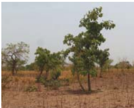
Jeunes karités âgés de cinq ans après greffage, au Burkina Faso.

Le système agricole traditionnel en vigueur dans les parcs consiste à alterner des cycles de culture et des jachères arbustives. La régénération naturelle des végétaux ligneux s'effectue autour des arbres implantés dans des friches. Le karité est rarement planté et la plupart des spécimens sont issus de la régénération naturelle.