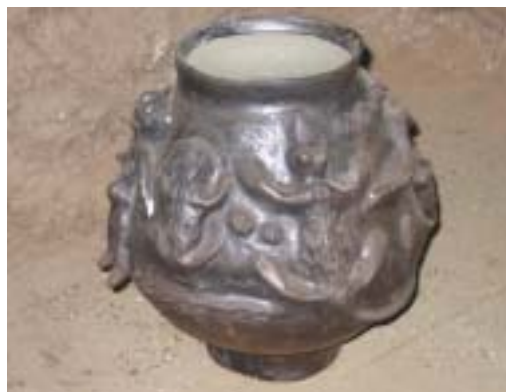
Pot décoré destiné au stockage à court terme du beurre de karité à Monno (Niki, Bénin).

Les arbres de prédilection des hommes et des femmes présentent des caractéristiques différentes, ce qui reflète la répartition du travail entre les genres. Les hommes préfèrent les arbres en pleine santé qui concurrencent peu les cultures, donnent de gros fruits, poussent vite et résistent au gui. Le choix des femmes se porte plutôt sur les arbres qui fournissent de grandes quantités de beurre. En général, les arbres qui ont un rendement constant d'une année sur l'autre et dont les fruits ont une pulpe sucrée et une forte teneur en graisse sont considérés comme les arbres idéaux. La teneur en graisse des grosses amandes est très faible. Les femmes préfèrent généralement les graines pe-