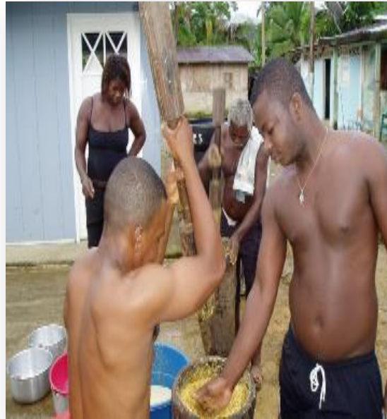
Foto # 4. Preparación de la mazamorra para la última novena San Marino 24 junio 2012”.

Luego las cantoras comienzan con los alabados que acompañan al muerto durante toda la noche. Cada dos horas se reza el rosario y se sigue cantando alabados y romances, mientras familiares y amigos lloran al muerto. Durante el velorio el muerto no se debe dejar solo.