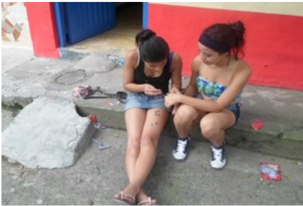
Figura 3: Mujeres socializando en la calle.

DESDE LA COTIDIANIDAD DE LAS MUJERES DEL BARRIO SAN GREGORIO.