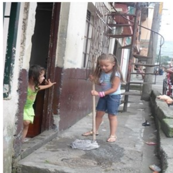
Figura 7. Replica de estereotipo femenino