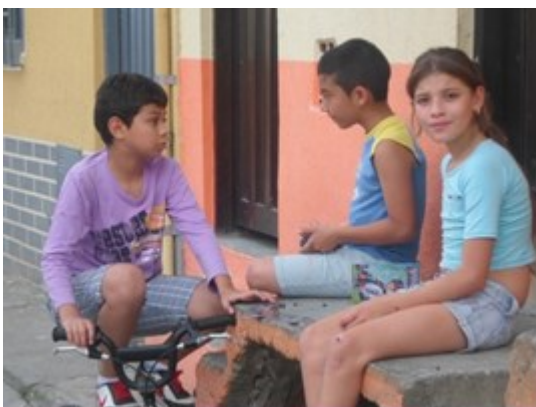
Figura 10. Presencia Vs vinculación