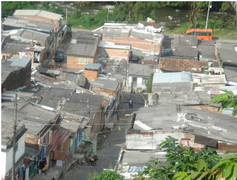
Figura 2 : Imagen del Barrio San Gregorio de Pereira, Risaralda.