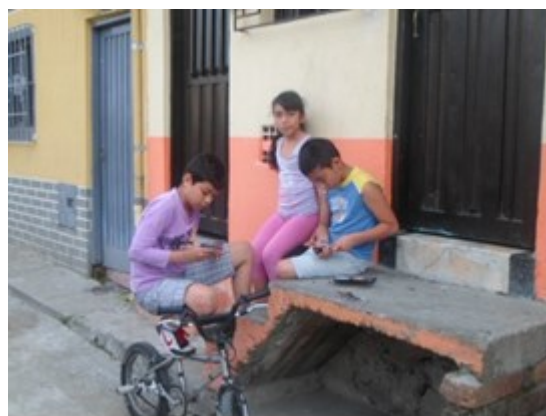
Figura 11. Los niños juegan, las niña observan