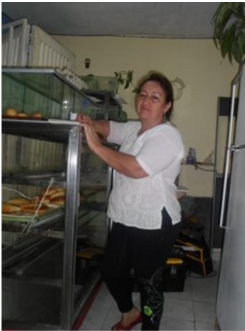
Figura 14. Las mujeres en sus diversas actividades.