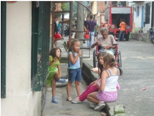
Figura 6. Niñas socializando en el andén.