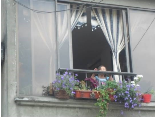
Figura 8. Niña socializa desde la ventana (Ámbito privado)