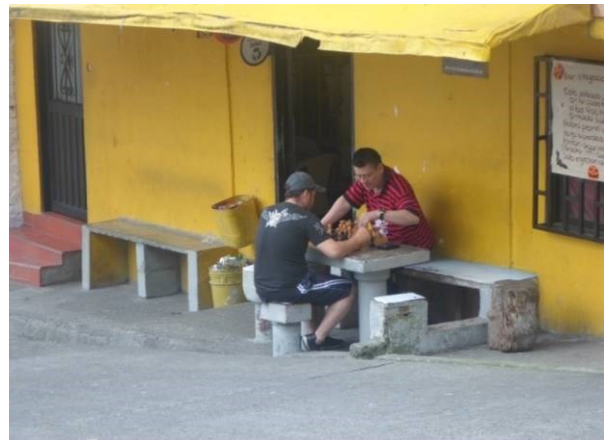
Figura 4. La tienda es un punto de socialización los fines de semana.