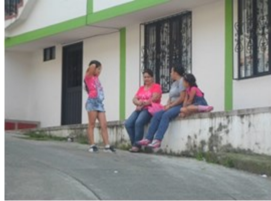
Figura 13. El andén, sitio de encuentro de vínculos.