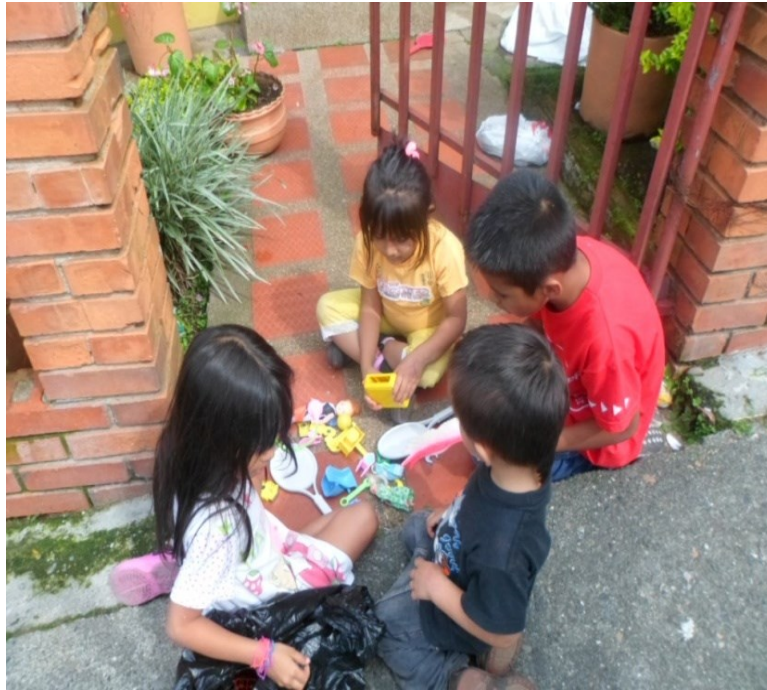
Figura 5. Niñas y niños jugando en el andén, extraen de la bolsa negra los juguetes, los reparten haciendo énfasis en cuáles son de los niños y cuáles de las niñas,- juego de roles.