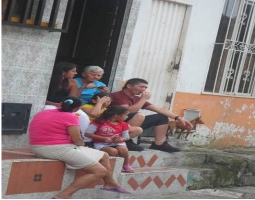
Figura 12. Familia compartiendo en la puerta de su casa .