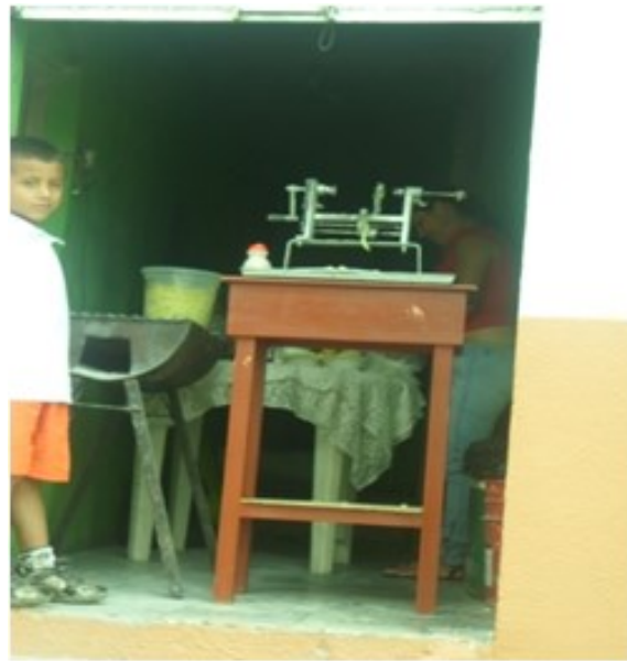
Figura 15. Las mujeres tejedoras de vínculos