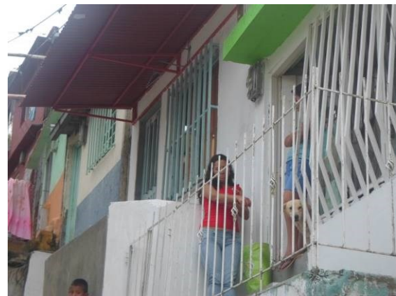
Figura 9. De lo público a lo privado. La puerta y los andenes sitios de socialización