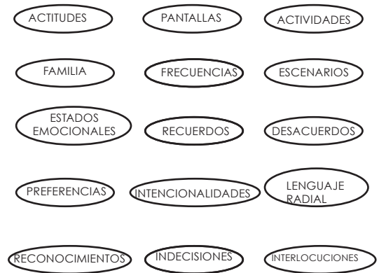
Figura 4. Nodos

que reúnen) para posteriormente identificar, relacionar, confrontar y abstraer los elementos obtenidos, por medio de agrupaciones y reagrupaciones que conducen a la construcción de categorías emergentes, a partir de las cuales se podrá establecer un diálogo entre teoría y práctica.