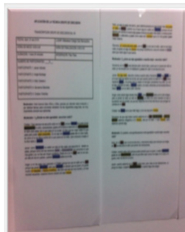
Figura 2: Registro escrito, consolidación del corpus textual

De esta forma se consolidó un guion de preguntas dirigidas a indagar sobre la manera como los sujetos-audiencias entablan mediaciones con el medio radial presente en la escuela.