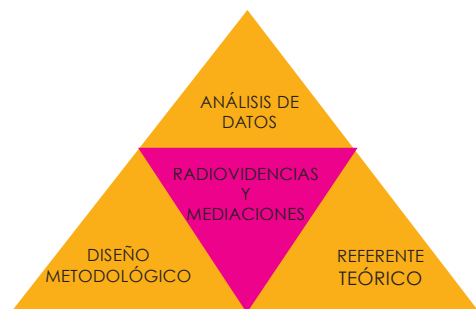
Figura 5. La triangulación

La triangulación es entendida como la combinación de teoría, método e información a partir de un fenómeno social particular. Es indispensable aclarar que la triangulación no consiste en la aplicación pura de una técnica, sino que surge más bien en el interés de desarrollar un proceso de diálogo entre tres los elementos mencionados con miras a determinar la relación que media entre estos y la discusión en los niveles conceptual y cognitivo, para esclarecer las inquietudes en que se basa la intención investigativa.