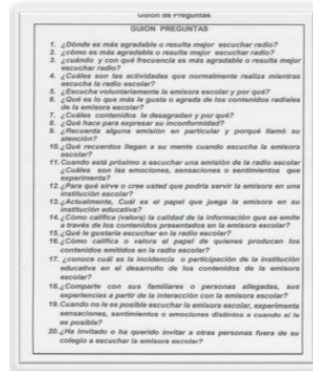
Figura 1. Guion de preguntas

de la información que se aplicaría a los estudiantes. Las preguntas se formularon de modo que se ajustaran a los lineamientos y categorías conceptuales de la mencionada teoría, que constituye el marco teórico de nuestra investigación. Para ello hubo que revisar los aportes teóricos y las posibles categorías.