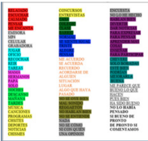
Figura 3. Rastreo y señalización de índices o marcas

marcas, de acuerdo con el establecimiento de puntos de referencia específica. Para ello se establecieron quince colores que determinarían ciertos índices relacionados con las macro y micromediaciones presentes en la radiovidencia. A manera de ejemplo podemos decir que de esta forma surgieron marcas como celular, computador, mp3 y mp4, que se constituyen en pantallas y hacen parte de la dimensión tecnológica de la radiovidencia en términos de Orozco. Cabe resaltar que la asignación de colores corresponde a la intención de organizar, clasificar y diferenciar las palabras clave que se rastrearán posteriormente en el corpus textual construido sobre la base de la transcripción de las intervenciones de los grupos de discusión.