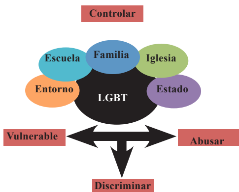
Imagen 2: Síntesis Construcción Social LGBT

La discriminación hoy día no está siendo limitada sólo por el rechazo social que pueda percibirse por una conducta o comportamiento en espacios públicos, hoy, está cruzada con elementos de tipo psicológico, verbal, laboral y familiar entre otras que tal vez se nos escapen, pero que son igualmente condenables y deplorables. Este acto de afirmación que pretende ordenar y separar a la población no es más que una restricción fundamentada en prejuicios y estereotipos, para este caso, impuestos por los sistemas heteronormativos sobre las conductas, pensamientos, posiciones y actitudes frente a alguna situación, espacio, idea, etc.