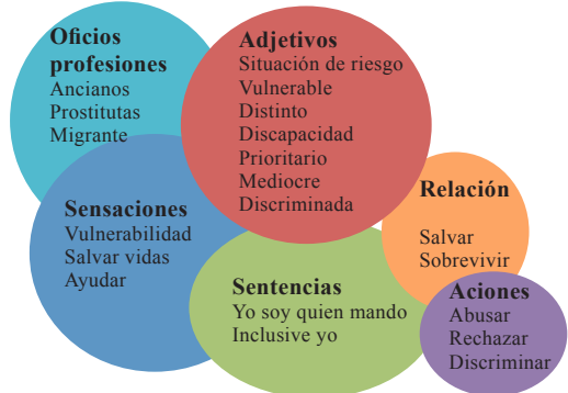
Imagen 1: Superposición de Grupos Prioritarios

También fue evidente una fuerte estructura conceptual sobre la necesidad de caracterizar a la población y de reconocer las capacidades físicas y emocionales que dependiendo de los contextos y las situaciones, las categorías, roles y etiquetas pueden llegar a perderse, en el que todos los sujetos son susceptibles de pasar a un estado de condición de vulnerabilidad, en donde el concepto de grupos prioritarios toma fuerza y se convierte en la carta de presentación, por ejemplo en la reagrupación de conceptos de los participantes encontramos en el siguiente gráfico: