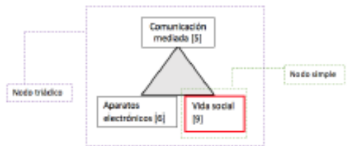
Esquema 5. Nodos triádicos. Resultado de la segunda agrupación

Posteriormente al tomarse las dos triadas simples para unir aquellas agrupaciones simples pero con aspectos comunes, se obtiene un nodo triádico como el que se puede apreciar en el esquema 5.