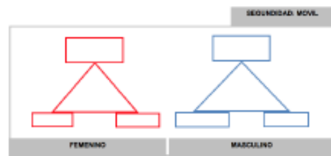
Esquema 9. Nodos triádicos de la Seguridad