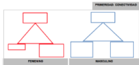
Esquema 8. Nodos triádicos de la Primeridad

Los nodos triádicos formulados a partir del estudio permiten constatar lo anteriormente expuesto: