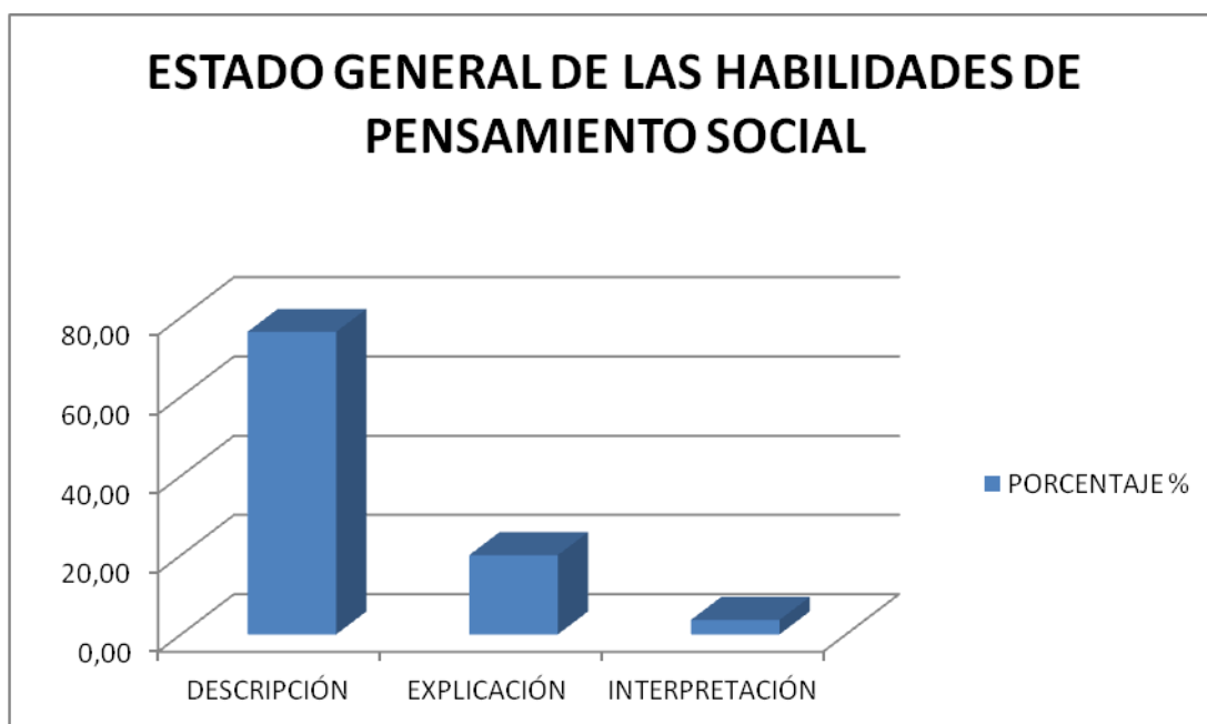
GRÁFICO 1. Estado general de habilidades de pensamiento social de forma.

Dicho proceso se obtuvo de acuerdo a las preguntas que se realizaron, no solo en el caso sino también al finalizar cada sesión que fue ejecutada. (Ver gráfica 1)