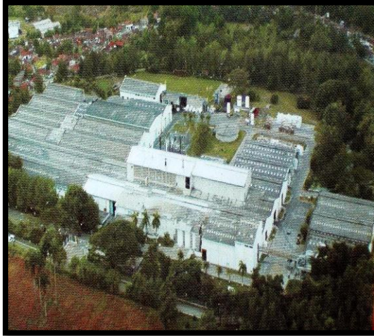
Figura 1. Planta de producción ubicada en Pereira Risaralda, vía Cartago Valle.