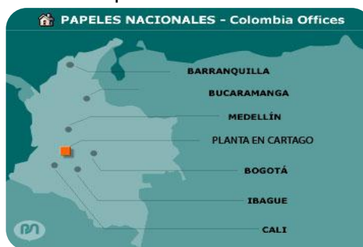
Figura 3. Mapa de localización de las diferentes sucursales a nivel nacional y de la planta de producción.

PAPELES NACIONALES S.A. cuenta con oficinas en las principales capitales del país y su sede principal, la planta de producción, se halla ubicada en paraje la marina vía Cartago Valle cerca al puente de Bolívar.