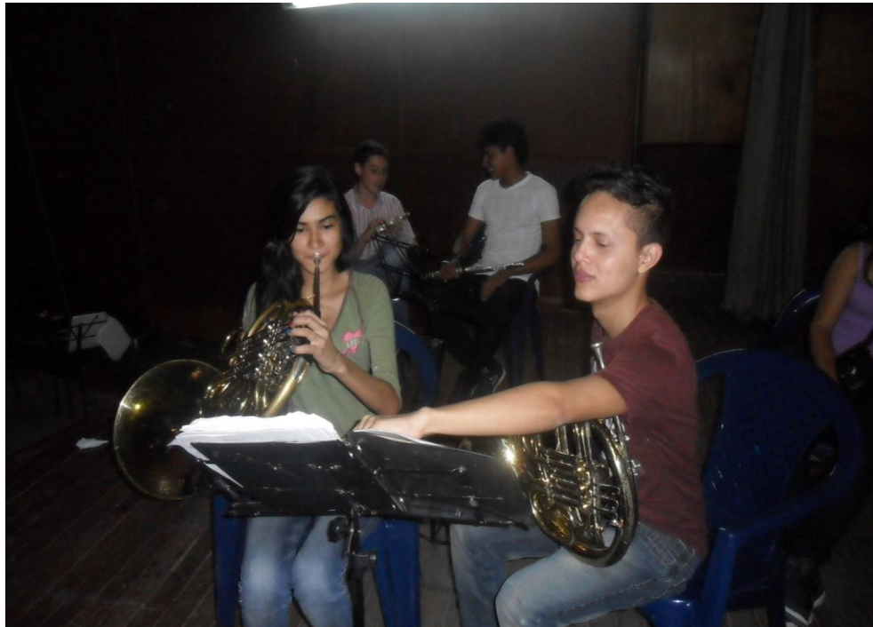
Foto 10 Estudio de Trompeta