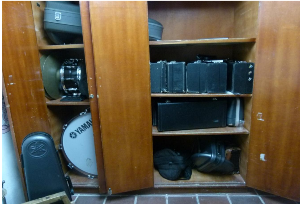
Foto 4 Escenario de Ensamble Colectivo