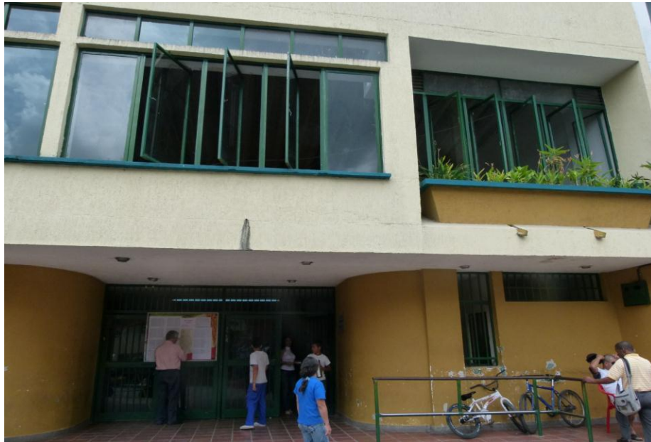
Foto 3 Entrada a la Institución