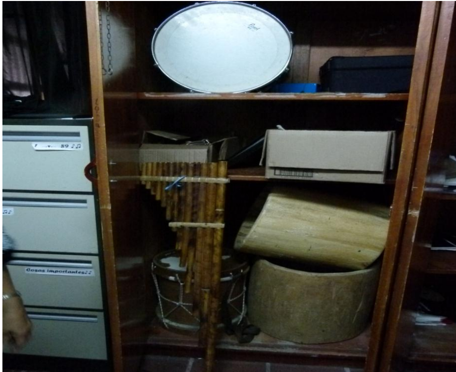
Foto 6 Estudio de Flauta