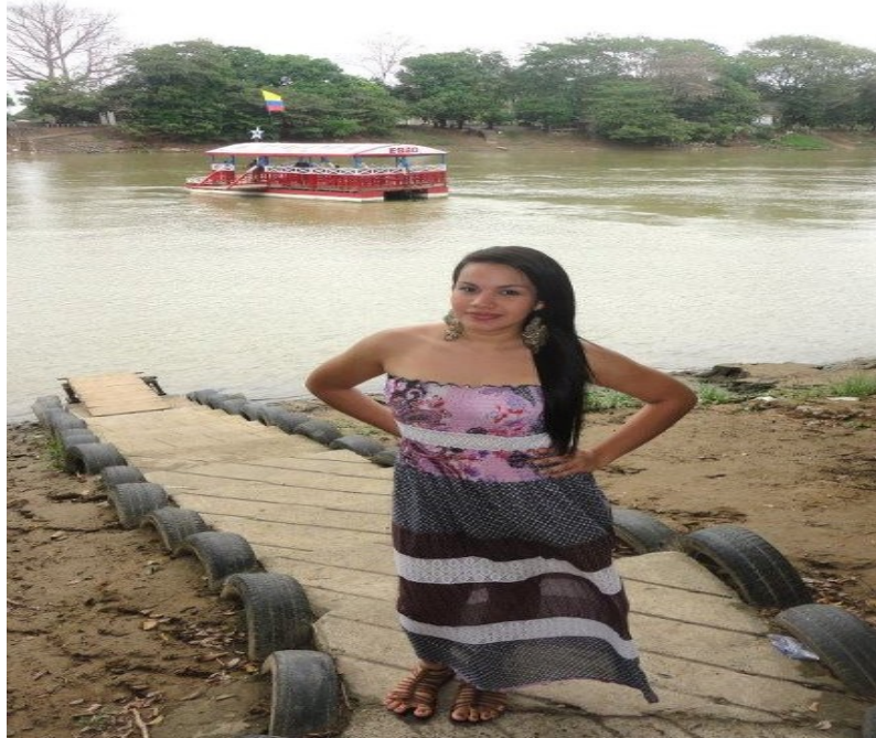
Las mujeres, un tema recurrente en los escritos de Guillermo Valencia S.