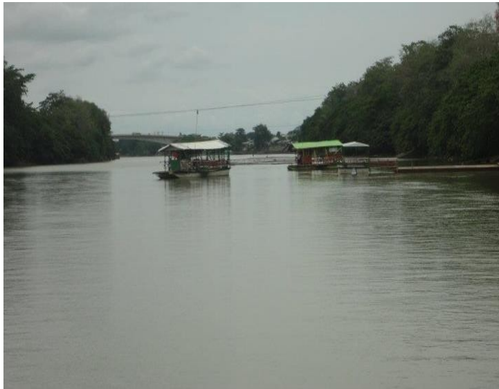
Los Planchones que atraviesan el Río Sinú.