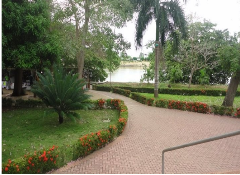
La Antigua Avenida Primera de Montería- ahora es La Ronda del Sinú.