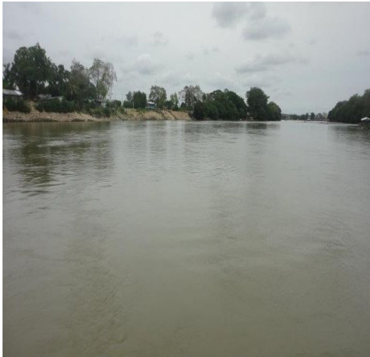
Río Sinú, Palabrita misteriosa e indescifrable