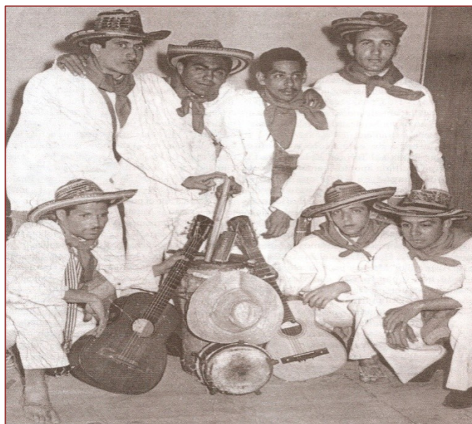
Conjunto musical de la Universidad Libre, 1961. Presentación en la Universidad Javeriana. Obtuvieron el primer puesto en el concurso.