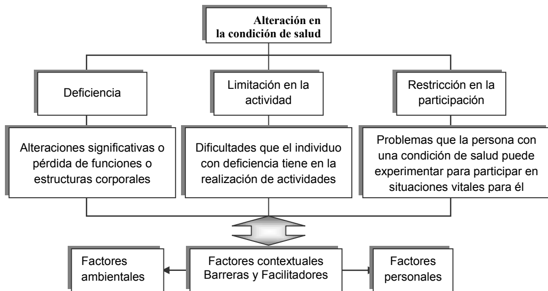
Figura 1. Clasificación Internacional del Funcionamiento, de la Discapacidad y de la Salud (CIF)

La discapacidad puede considerarse como una experiencia de vida que cada persona que la tiene, la vive en forma diferente. Esta depende no solo de la deficiencia o de la limitación que presente en la realización de una actividad; sino que además está determinada por las barreras u obstáculos o los facilitadores o apoyos que la persona con una discapacidad encuentra en su contexto y que finalmente son los que determinan el grado de participación que esta pueda tener en su entorno. Los postulados planteados se resumen en la siguiente figura: