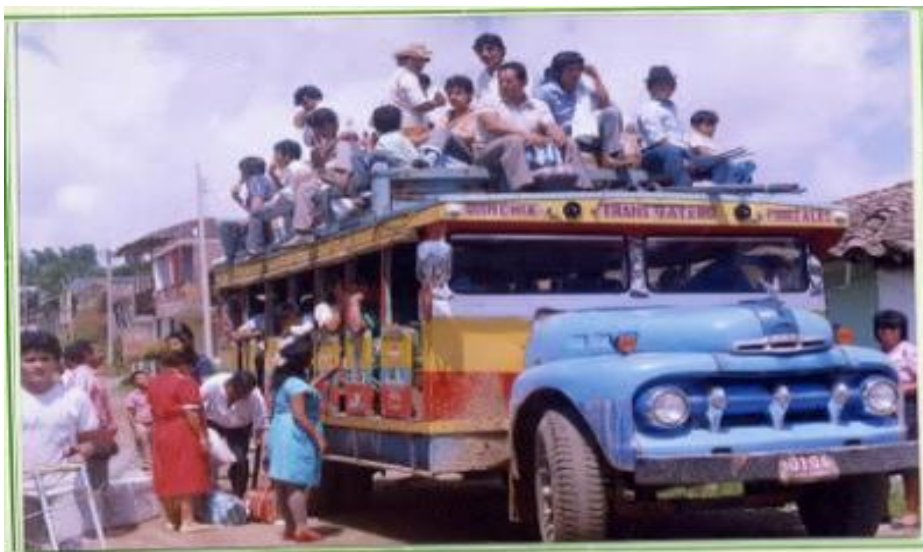
Ilustración 7. Foto medio de transporte de Quinchía

El municipio de Quinchía se encuentra ubicado en la región nororiental del departamento de Risaralda en la vía que conduce de la ciudad de Pereira a la ciudad de Medellín, es un municipio cuya población rural es el 70% y su economía está basada en la agricultura.