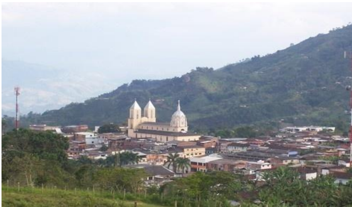
Ilustración 6. Foto cabecera municipal Quinchía