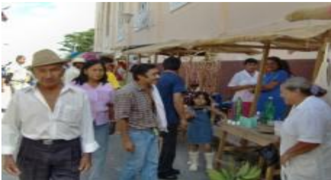
Ilustración 2. Fotografía de de mercado