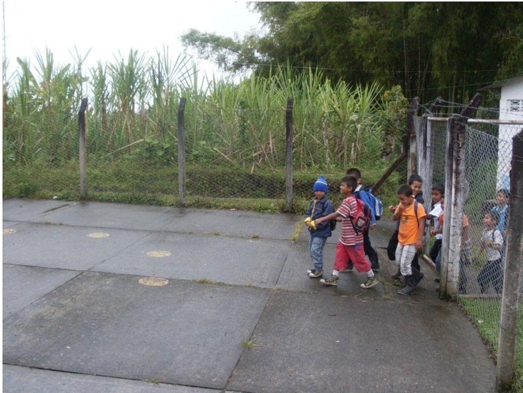
Ilustración 12. Foto niños escuela La Itálica

El alumno en esta institución educativa se pretende formar en valores éticos, morales, intelectuales, culturales y patrióticos de acuerdo con nuestra constitución nacional.