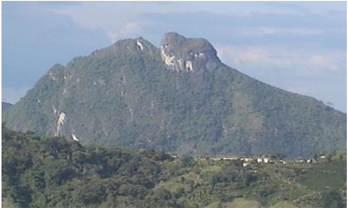
Ilustración 4. Foto cerro Batero

Quinchía se encuentra ubicado al nororiente del departamento de Risaralda y limita al norte con el Municipio de Riosucio; Al sur con Anserma, por el oriente con los municipios de Filadelfia y Neira y por el occidente con el Municipio de Guática.