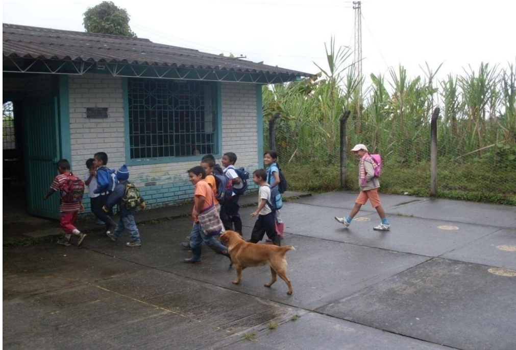
Ilustración 13. Niños escuela La Itálica

Se busca formar integralmente la motricidad con capacidad de descubrir sus propias habilidades artísticas y deportivas.