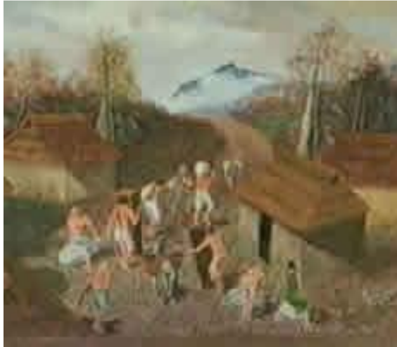
Ilustración 1. Foto llegada de indígenas Guacuma