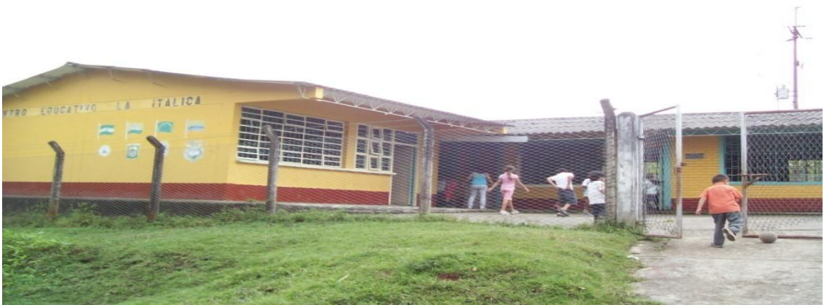
Ilustración 11. Foto niños escuela la Itálica