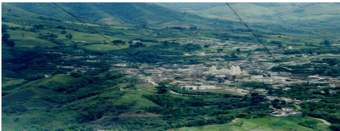
Ilustración 3. Panorámica de Quinchía, área urbana

Quinchía está situada a una altura de 1.825 metros sobre el nivel del mar y la temperatura promedio es de 18 grados centígrados. Posee todos los climas, desde el cálido de Irra, hasta el frío de la Ceiba. Quinchía se encuentra ubicado al nororiente del departamento de Risaralda y limita al norte con el Municipio de Riosucio; Al sur con Anserma, por el oriente con los municipios de Filadelfia y Neira y por el occidente con el Municipio de Guática. Esta a 110 kilómetros de la capital del departamento, Pereira que se convierten en 2 horas por vía carrete