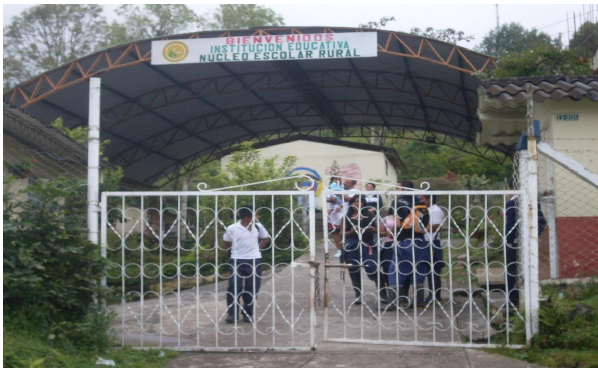
Ilustración 8. Entrada I.E. Núcleo Escolar

En cumplimiento de los preceptos de la Ley 115 de 8 de febrero de 1994 y su Decreto Reglamentario 1860 de 3 de agosto de 1994 y la Ley 715 de 21 de diciembre de 2001; que establecen en su orden organizar el servicio de educación en los establecimientos educativos oficiales y privados de Colombia para que en su oferta educativa propongan a la comunidad educativa la calidad de colegio completo es decir que tengan en aplicación los niveles de: Preescolar, Básica ciclos Primaria – Secundaria y la Media.