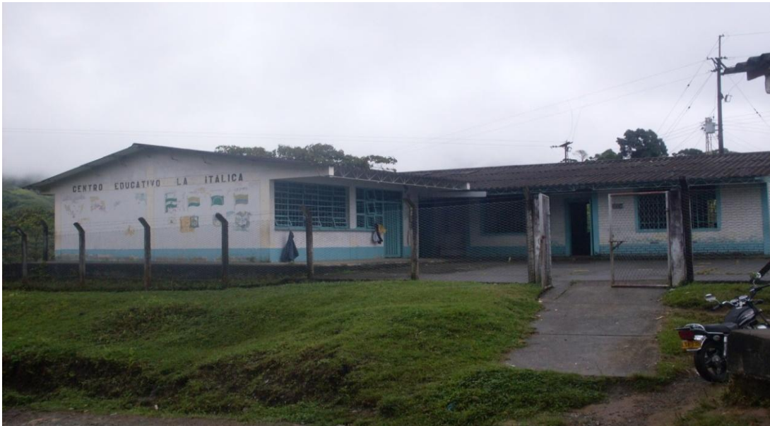
Ilustración 10. Foto escuela la Itálica