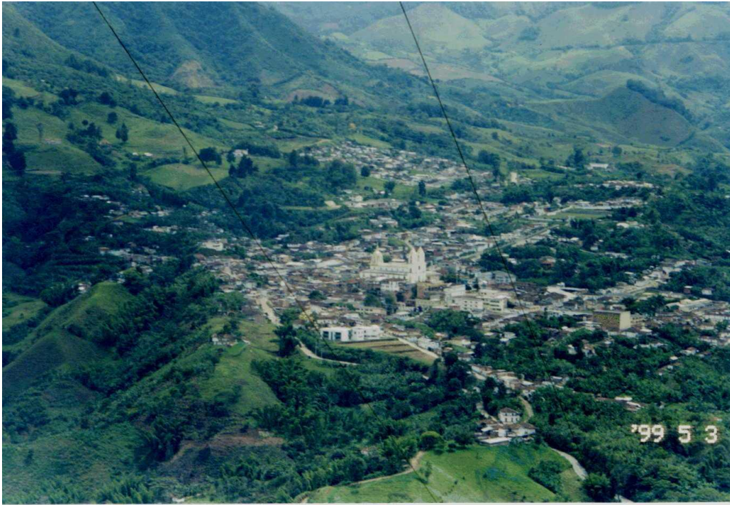
Panorámica de Quinchía

Sólo hasta 1919, con la ordenanza número 5 del 12 de marzo de 1919 dio nacimiento legal al municipio de Quinchía. En 1966, al crearse el departamento de Risaralda, Quinchía pasó hacer parte de esa unidad administrativa; en 1985 la cabecera Municipal fue elegida por la gobernación como “el pueblo más lindo de Risaralda”.