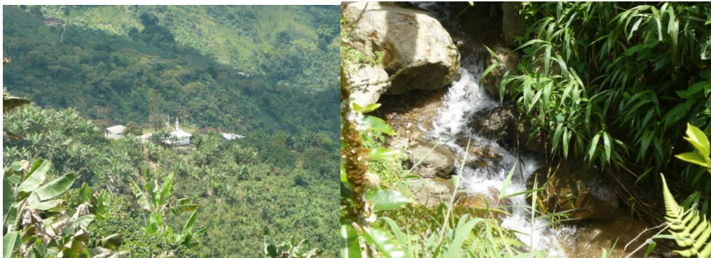
Minería, agricultura, áreas protegidas y micro cuencas de Quinchía

La economía básica de la región la podemos resumir en dos: agrícola y minera, dada su posición geográfica equidistante a los principales centros del país como son Medellín, Pereira, Manizales, Bogotá y Cali. Quinchía se ha convertido en un municipio de gran futuro y dinamismo en la economía regional. La producción de café es de excelente calidad, también es importante por sus cultivos de plátano, yuca, caña panelera y en los últimos años se ha posicionado como uno de los municipios con mayor producción de mora,; en la parte minera se destaca Quinchía por ser importante productor de oro y en menor escala de carbón.