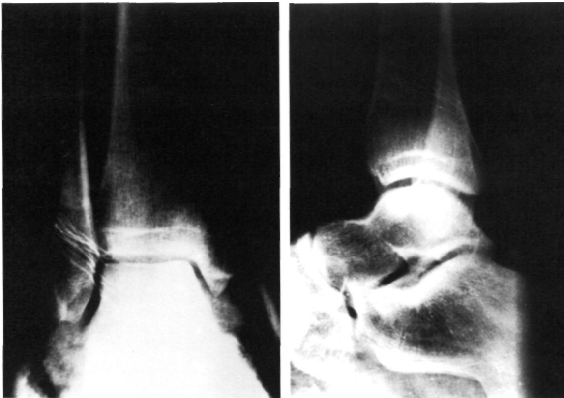
Figura 2. Radiografías anteroposterior (a) y lateral (b) del tobillo en el postoperatorio inmediato mostrando una reducción congruente y ausencia de fracturas maleolares.

Este tipo de lesiones son típicas de varones jóvenes y ocurren habitualmente en la práctica de-