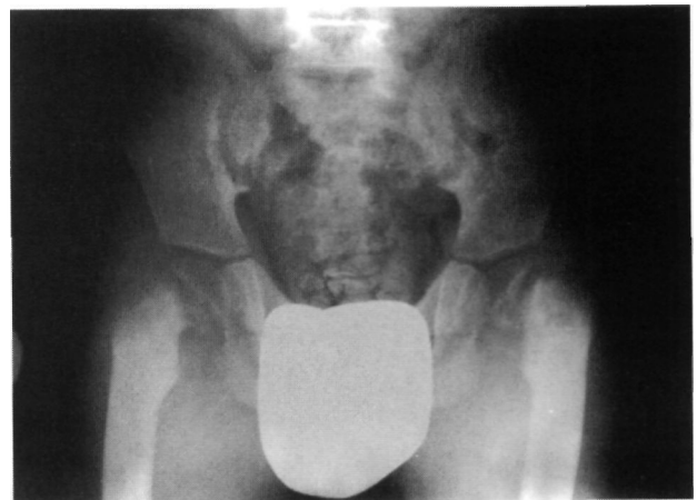
Figura 1. Coxa vara bilateral provocada por reabsorción inferomedial del cuello femoral con desencadenamiento de epifisiolisis en niño con insuficiencia renal terminal en tratamiento sustitutivo mediante hemodiálisis.