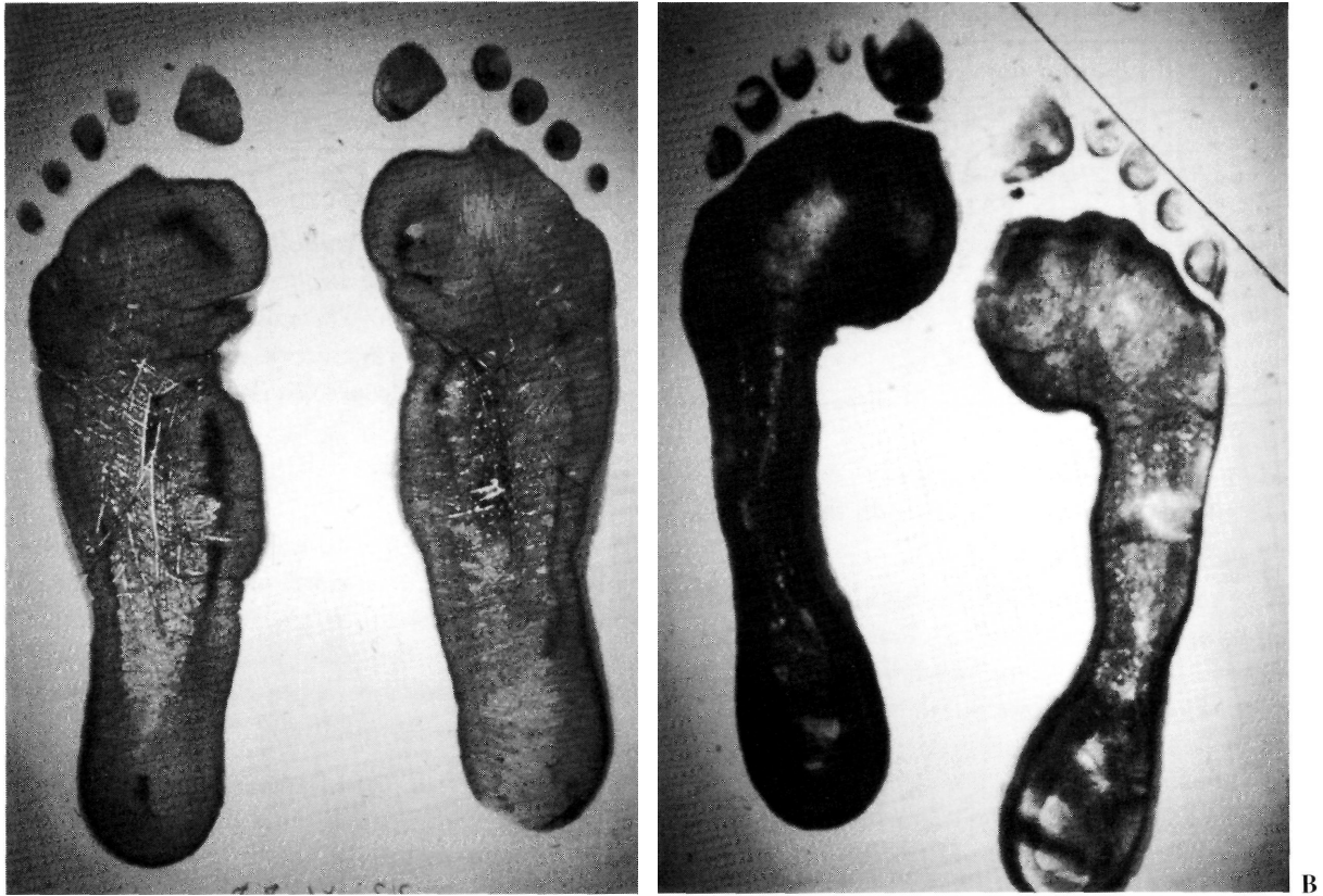
Figura 2. Corrección del fotopodograma tras la intervención de Giannini. A: Fotopodograma preoperatorio. B: Fotopodograma postoperatorio.

Se han descrito gran variedad de métodos quirúrgicos y el procedimiento utilizado por nosotros hasta 1989 ha sido la técnica y endortesis de Viladot (22-24), con lo que hemos obtenido un 88% de resultados entre excelentes y buenos, y de hecho el primer paciente en que empleamos la endortesis de Giannini (7) era portador de una prótesis de Viladot en el pie previamente intervenido, con lo que pudimos comparar los 2 métodos y obtener unos