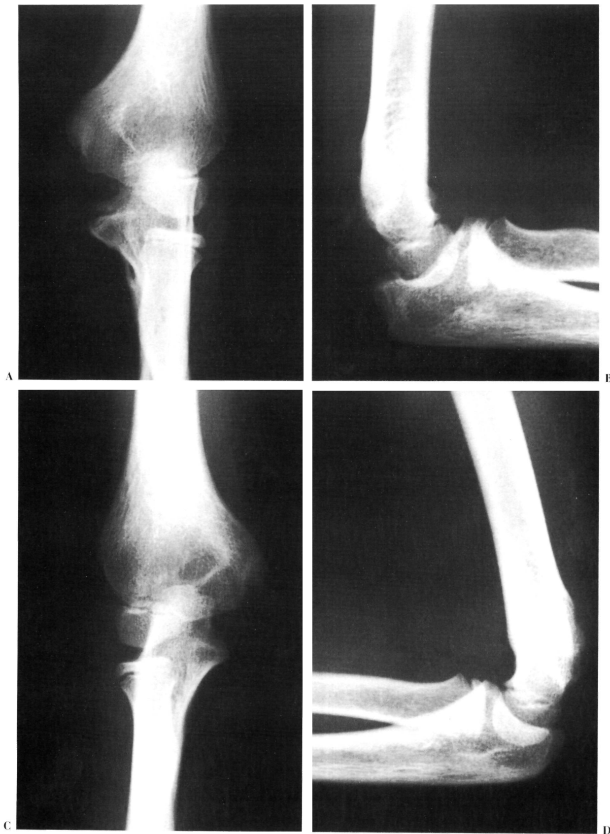
Figura 2. A y B: Controles radiográficos a los 18 meses. Llama la atención la dismorfia de la punta del olécranon comparándolo con el codo contralateral, el callo vicioso en su borde interno y la calcificación heterotópica en el tendón del tríceps. C y D: Radiografía anteroposterior y lateral del codo contralateral sano.