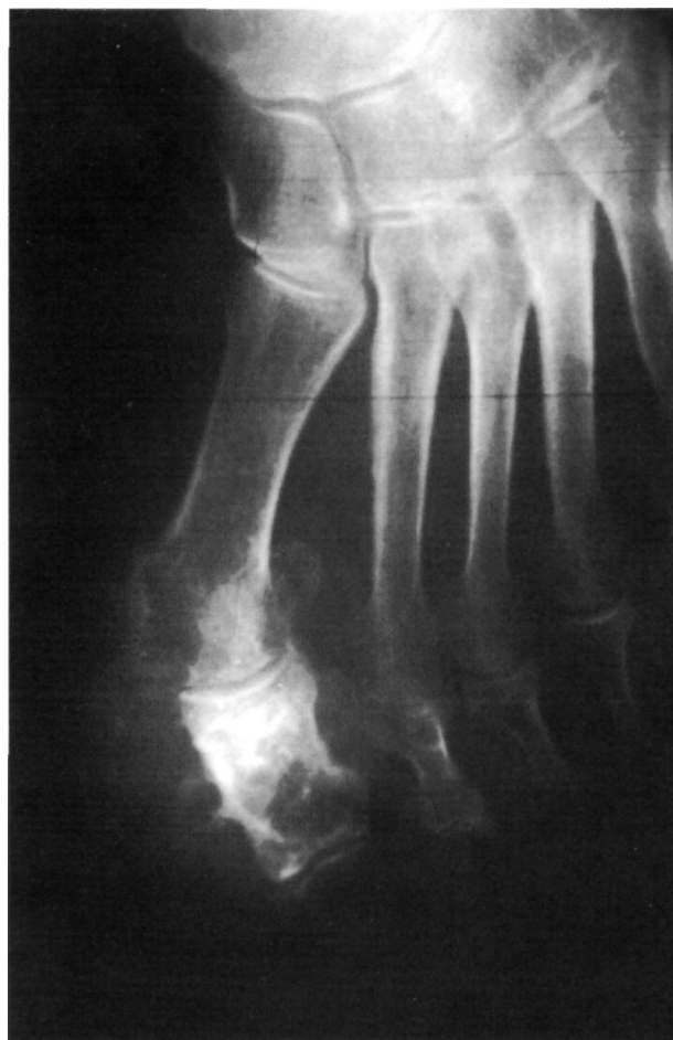
Figura 1. Lesión localizada en falange proximal del primer dedo. Expansión de corticales y calcificaciones.

Dr. F. COLLADO TORRES Servicio de Cirugía Ortopédica y Traumatología Hospital General Básico de la Axarquía Urbanización El Tomillar, s/n. 29700 Vélez-Málaga (Málaga)