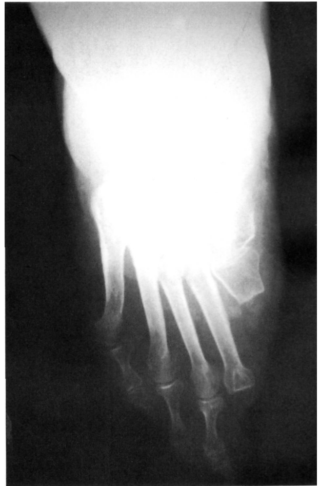
Figura 4. Imagen radiológica del pie 3 años y medio después de la cirugía.

Practicamos exéresis local amplia de la lesión extirpando toda la zona tumoral, que está bien delimitada, y