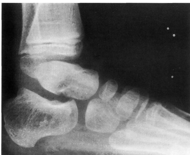
Figura 2. Radiografía lateral en la que se aprecia un aplanamiento de la cúpula del astrágalo.

2. Nosotros resumimos el segundo y tercer tiempo de la técnica original de Imhäuser en uno solo: el hemitrasplante externo del tibial anterior.