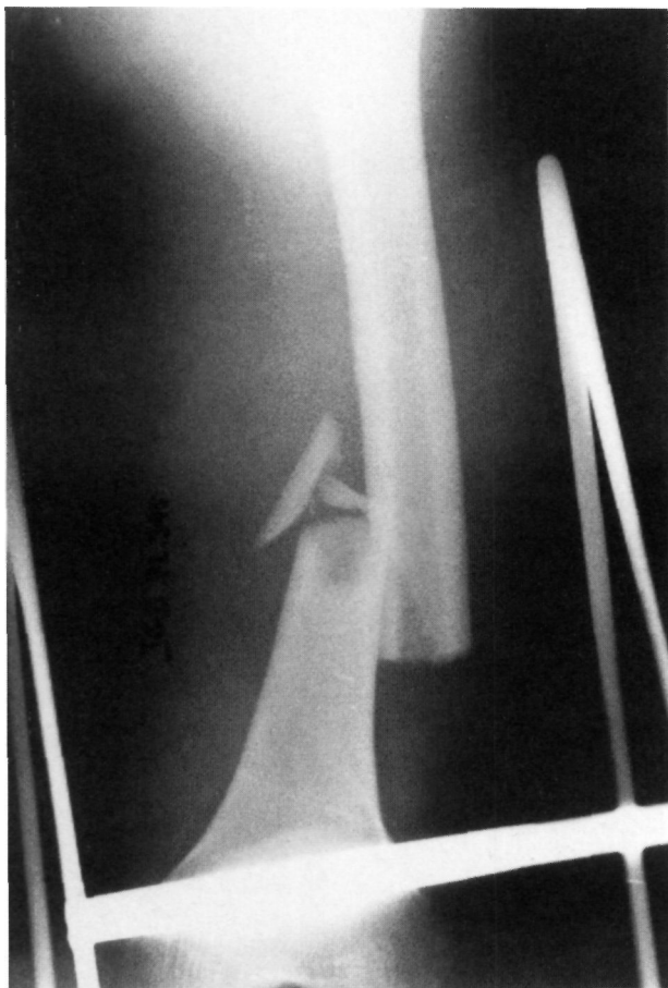
Figura 1. Fractura de tercio distal de fémur en un varón de 18 años producida por accidente de tráfico.

El objetivo del presente trabajo es aportar nuestra experiencia con este tipo de clavo.