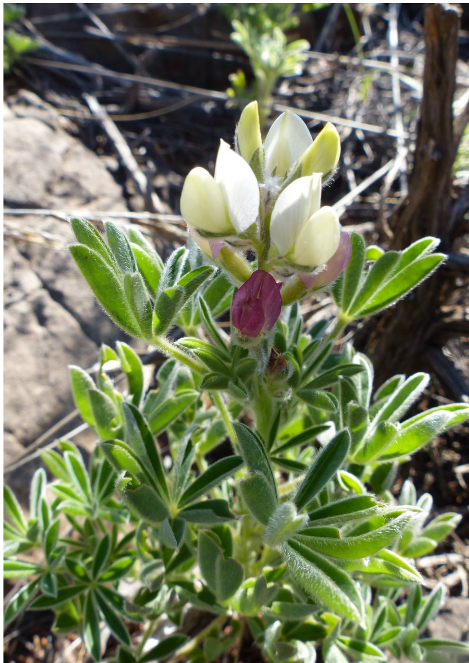
Fig. 3. Aspecto de un ejemplar en flor de Lupinus mariae-josephae de la población de Riba-roja de Túria (Valencia) en abril de 2016.