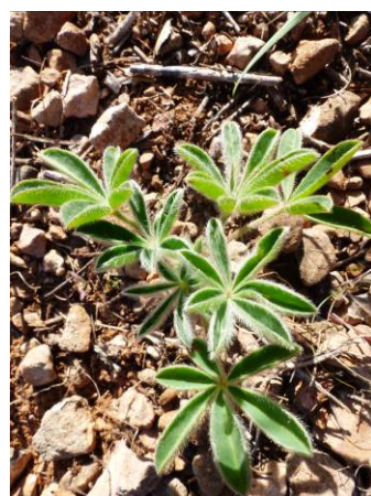
Fig. 2. Ejemplares de la población de Lupinus mariae-josephae de Riba-roja de Túria (Valencia).