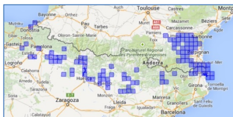
Fig. 3. Distribución de Dittrichia viscosa en el Pirineo con cuadrícula UTM de 10x10 km.