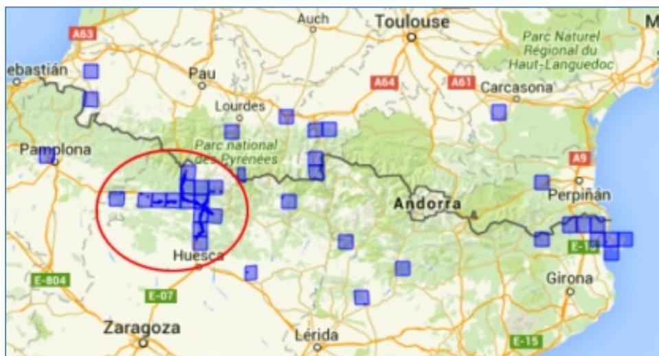
Fig. 1. Distribución actual de Ditricchia graveolens en el Pirineo con cuadrícula UTM de 10×10 km.

Como puede verse en el las figuras 1 y 2 procedentes del AFP, Ditricchia graveolens se ha expandido rápidamente por las cunetas de las carreteras nacionales de la provincia de Huesca que penetran en el Pirineo. La hemos visto de manera casi continua en la N-330 desde Arguis por el sur hasta Canfranc Estación en su límite norte, pasando por Sabiñánigo y Jaca, sumando 75 km de carretera; además aparece en los tramos de autovía en servicio de la A-23 paralelos a la N-330.