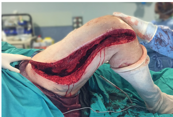
Figura 6. Comprobación de la flexión pasiva de rodilla tras la realización de la fase 3 (100°).