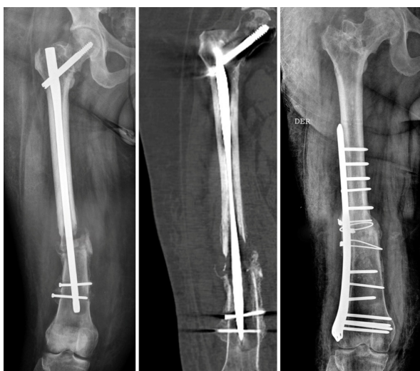
Figura 1. Imágenes de radiografía y TC. Izquierda y centro: se observa la ausencia de consolidación de la fractura diafisaria de fémur y consolidación parcial de la fractura pertrocantérea. Derecha: estabilización de la fractura mediante placa de compresión bloqueable y cerclajes.

Al 7º mes post-intervención, el paciente acude a Urgencias por dolor en la raíz del miembro intervenido, con una temperatura de 39°C y una proteína C reactiva (PCR) de 275 mg/l. En la ecografía se detecta líquido en el receso anterior de la articulación coxofemoral derecha y en la tomografía computerizada (TC) una consolidación parcial de la fractura pertrocantérea y ausencia de consolidación en la fractura diafisaria (Fig. 1). Se realiza artrocentesis diagnóstica de la articulación coxofemoral extrayéndose 10 cc. de líquido de aspecto purulento, identificándose en el cultivo un Enterococcus cancerogenus y pautándose antibioterapia según antibiograma. El paciente es reintervenido para la extracción del material de osteosíntesis, comprobando bajo radioscopia la estabilidad de la fractura pertrocantérea, limpieza de la zona de infección, y desbridamiento del foco de fractura diafisario, retirando las membranas intramedulares y colocando un sistema osteoconductor (sistema STIMULAN Rapid Cure ® , MBA ® ) con meropenem. Se estabiliza la fractura con un fijador externo en el fémur derecho, comprobándose su posicionamiento con radioscopia intraoperatoria.