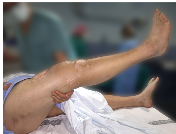
Figura 2. Bajo anestesia raquídea se comprueba la flexión de la rodilla contra gravedad previa a la intervención (20°).

Se exanguinó el mismo mediante elevación y una venda de Esmarch que se mantuvo como método para conseguir la isquemia puesto que se previó que la incisión podría extenderse hasta la región intertrocantérea y sería necesario su retirada para poder ampliar el abordaje.