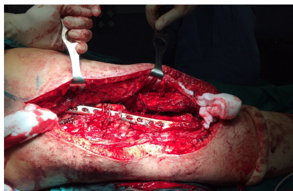
Figura 4. Fase 2 de la cuadricoplastia modificada de Judet. Prolongación de la incisión lateral y liberación de adherencias. Se aprecia el material de osteosíntesis de la intervención previa, que no se retira.