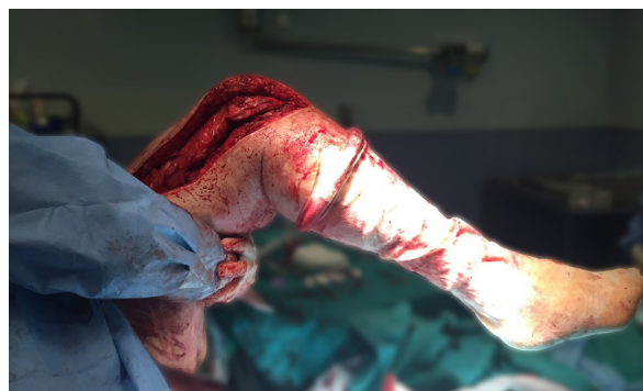
Figura 5. Comprobación de la flexión contra gravedad de rodilla tras la realización de la fase 2 (70°).