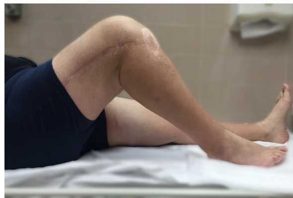
Figura 7. Flexión de rodilla a los 12 meses postintervención (95°).

que se aumentó a 95° al 5° día. El paciente recibió el alta hospitalaria al 8° día post-intervención y continuó con la rehabilitación en el gimnasio del hospital.