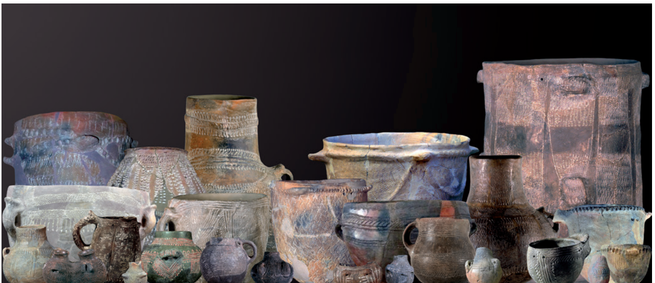
Fig. 1. Cerámicas de la Cova de l'Or decoradas con la técnica de la impresión cardial.

Los restos humanos localizados en la cavidad están siendo objeto de estudio por parte de M. Paz de Miguel y todavía no se cuenta con el número mínimo de individuos recuperados. Se han seleccionado cuatro muestras para su datación (tabla 2), dos del Sector F, una del Sector G y otra del Sector H (Salazar-García, 2012). Dos de estas muestras fueron recuperadas en estratos fechados en el Neolítico antiguo cardial, una en la capa 6 del cuadro H-3 (MAMS-19065) y otra en la capa 7 del cuadro F-4 (OxA-V-2360-19). Las otras dos lo fueron en contextos menos definidos, con materiales de diferente cronología, una en la capa 2 del Sector G (MAMS-19064) y otra en la capa 1 del cuadro F-2 (OxA-V-2360-21). A excepción de la mandíbula recuperada en la capa 6 del cuadro H-3, todas han proporcionado un marco cronológico del Neolítico final-Calcolítico.