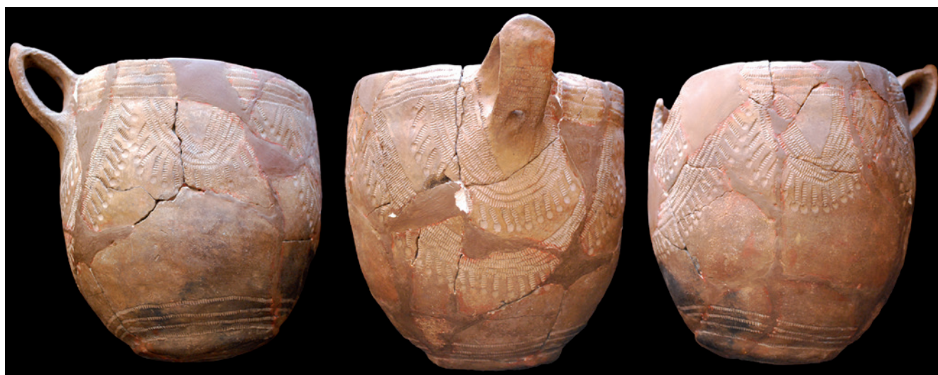
Fig. 2. Vaso cerámico decorado con la técnica de la impresión cardial encontrado junto a la inhumación doble de la Cova de la Sarsa.

Estas evidencias indican, al menos por ahora, que los contextos funerarios del cardial valenciano se componen de un número limitado de individuos, estando ausentes también las inhumaciones al aire libre. Los restos documentados hasta la fecha se han recuperado en cuevas de diferente morfología. En los huesos no se han identificado marcas antrópicas de proce-