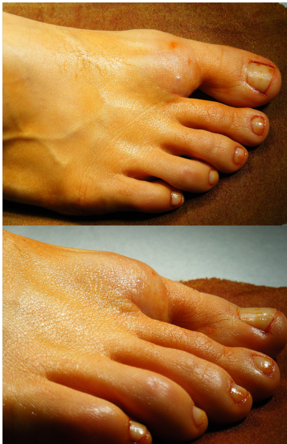
Figura 1. Imagen del pie derecho, donde se observa la tumoración localizada en la zona dorsal del primer espacio intermetatarsiano y base de primera comisura.

La radiografía simple no mostraba afectación ósea. En el estudio de Resonancia Magnética (RM) se apreciaba una lesión de partes blandas de 2,6 x 1,5x 1,3 cm., de localización superficial en el pliegue interdigital entre el 1º y 2º dedo a nivel dorsal, que no condicionaba invasión de estructuras adyacentes. La referida lesión presentaba señal intermedia en secuencias T1 con alta señal en secuencias T2. Se objetivaron algunas imágenes serpiginosas en su interior en ambas secuencias que sugerían estructuras vasculares. Tras la administración de contraste paramagnético se apreciaron discretos focos de captación en el interior de la lesión. Por estos hallazgos se apuntó el hemangioma capilar como primera posibilidad diagnóstica (Fig. 2).