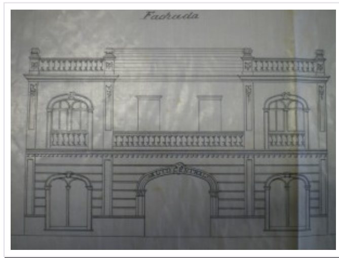
Fachada del Garaje Auto-Central (Proyecto de D. Francisco Almenar).

Los primeros garajes empezaron a funcionar en Valencia a principio de los años 20 y se ubicaron principalmente en el Ensanche Noble de Valencia. Inicialmente se trataba de edificaciones en patios de manzana, con acceso por la planta baja de los edificios de viviendas o incluso ocupaban otras edificaciones como cobertizos y naves-almacén que se reconvertían para albergar los automóviles.