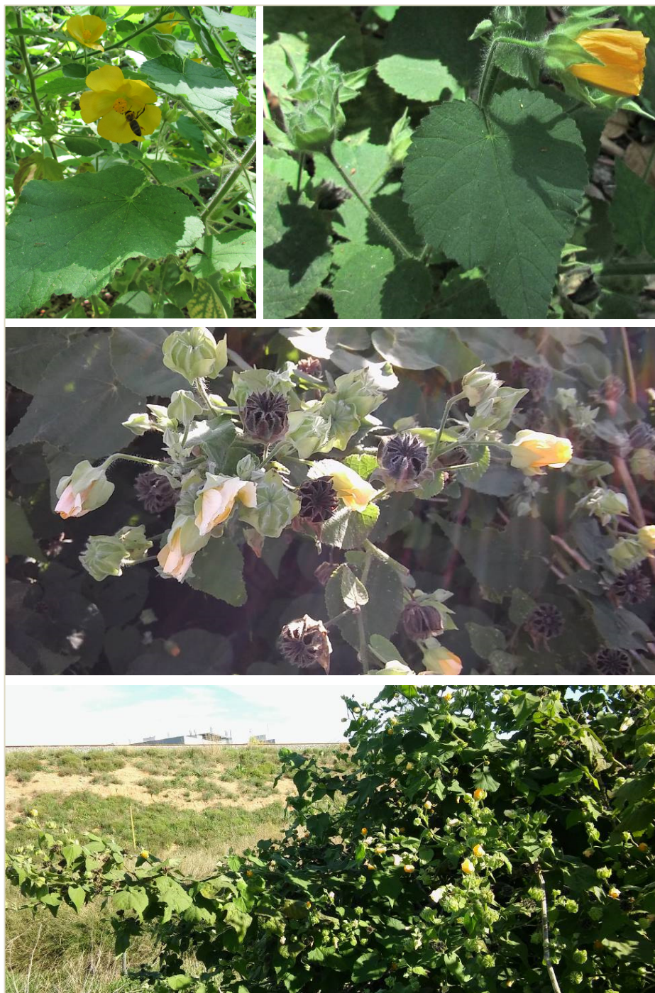
Fig. 1. Abutilon arboreum , detalle de las hojas, flores y frutos, y ejemplares asilvestrados en el margen de la Autovía V-30 (Valencia).