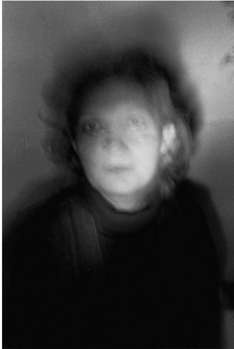
“M, sobreviviente” – Desapariciones , Helen Zout, 2011.

Encontrar el modo de hacerlo es el desafío que se propone la artista. En algunos casos, por ejemplo en los retratos de Nilda Eloy y de otra sobreviviente nombrada sólo con la inicial M., Zout usa un recurso frecuente en su obra: el de la doble exposición.