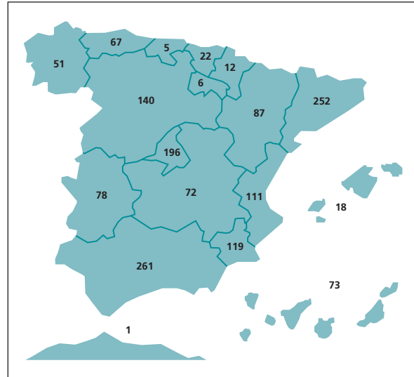
Figura 2. Contribución de las CC.AA. a la producción científica.

El análisis de la geografía de las firmas institucionales revela que desde todas las Comunidades Autónomas, además de la ciudad de Melilla, se han aportado trabajos a la producción analizada.