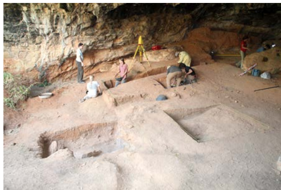
Fig. 2. Panorámica general de los sondeos efectuados en la reciente campaña de 2015.