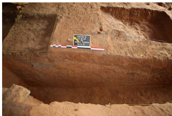
Fig. 3. Foto de detalle de los sondeos 2 y 5 desde la zanja efectuada por Fortea.

seguir (muestreros 1, 2 y 3). En este punto planteamos un segundo sondeo que trataba de delimitar el corte transversal de la cata de Pericot y cuya estratigrafía podíamos seguir desde el vaciado de la zanja. El sondeo 2 ha abarcado los cuadros EE 7S, FE 7S, EE 8S, FE 8S. Un tercer sondeo se ha llevado a cabo en el sector pequeño excavado por Fortea (cuadros A' 8, A' 9, A' 10, B' 8, B' 9, B' 10). En este punto nos limitamos a limpiar un área de 6 m 2 y a practicar un pequeño sondeo (sondeo 3) en el cuadro A' 7 de Fortea (AE 7S) siguiendo el perfil dejado por la excavación de éste una vez se hubo procedido a su limpieza. Un cuarto sondeo (sondeo 4) se ha practicado en el área de la entrada de la cueva (cuadros JE 1S, JE 2S, KE 1S, KE 2S) con el fin de comprobar si quedaba depósito intacto en este punto. El sondeo 5 se localiza en los cuadros CE 7S y CE 8S. Por último, el sondeo 6 corresponde a una cata de 1m 2 realizada en el cuadro CE 10S.