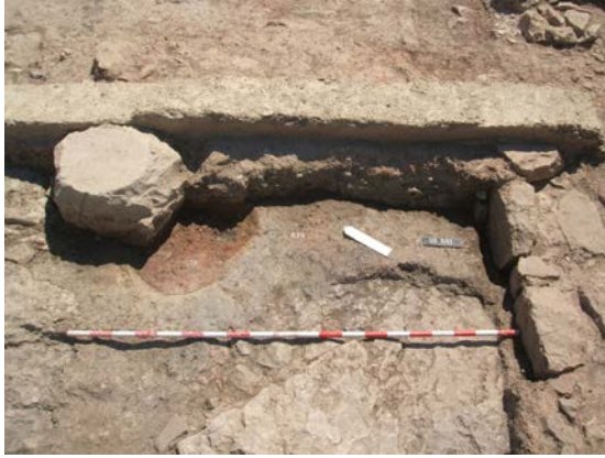
Fig. 4. Detall de l'Ambient 2 amb la llar UE 880, la superfície de trànsit UE 879 i el barandat UE 842, tot just per davall de la base de columna UE 847.

amb l'Ambient 1. Les seues dimensions són 6,65 x 5,73 m. Ací també es documentaren diverses estructures d'ocupació corresponents a una fase preromana, com nivells de trànsit de terra piconada (UUEE 878 i 879) associats a llars (UUEE 877 i 880) de cronologia ibèrica plena. D'aquests, el nivell d'ocupació del terra UE 879 i la llar UE 880 funcionaren de manera sincrònica amb el mur UE 868 (fig. 4). El mur UE 886 degué ser coetani del mur UE 838 de l'Ambient 1, malgrat no estar connectats físicament, segons la seua cota, per trobar-se