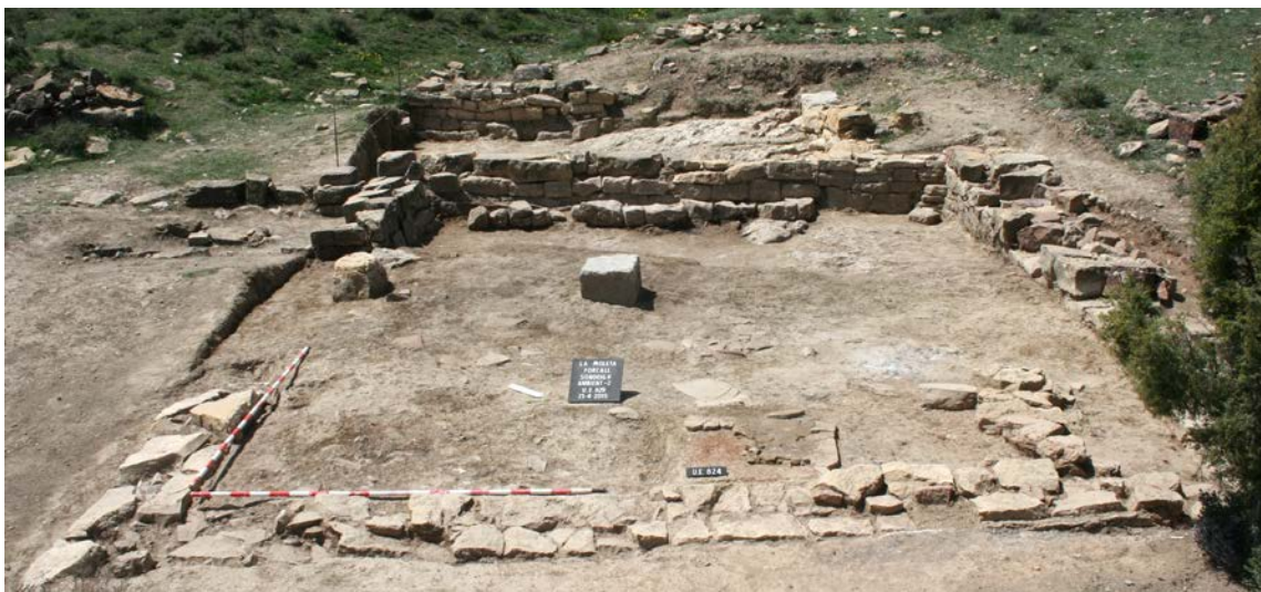
Fig. 5. L'Ambient 2 des de l'E, amb les restes corresponents al segon moment d'ocupació.

L'Ambient 2 tenia el seu accés a través d'una porta orientada al S d'uns 2,75 m de llum que s'obria al centre del mur UE 828, i possiblement comptava amb una columna assentada sobre la base UE 847. Aquesta habitació presenta dues fases constructives que poden identificar-se a partir de la seqüència estratigràfica i la lectura