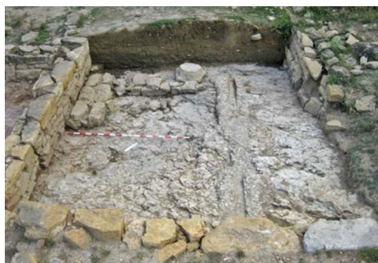
Fig. 3. Vista des del N de l'estat final de l'excavació de l'Àmbient 1, amb la canalització i una de les bases de columna.

D'altra banda, en l'extrem S d'aquest Àmbient 1 es trobà una base de columna (UE 845) situada a 1,87 m del mur UE 805, que està alineada amb un altra, situada en la base del mur UE 807, i podria pertànyer a una porxada situada en aquest costat que donaria pas a una hipotètica entrada a l'Àmbient 2 pel costat O. Finalment, tallats per la canalització i la base de columna, apareixien nivells