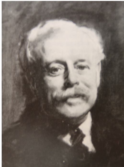
Figura 4. Sir Robert Jones.

Aunque la filosofía no intervencionista de Thomas no fue popular, lo que realmente desconcertaba a sus colegas era el hecho de que él, un provinciano totalmente desconocido, hubiera decidido criticar a algunas de las figuras más distinguidas del territorio; la profesión médica decidió que Thomas no era un gentleman . Thomas no encontró a ningún colega que tuviera buenas palabras con él; incluso los que antes le habían apoyado de alguna manera, ahora decidieron rechazarle a él y sus principios, lo cual reportó graves consecuencias en los años que estaban por llegar. Sin embargo, cuando Thomas murió en 1891 a los 57 años, la gente pobre con la que convivió le ofreció el testimonio elocuente y enterrecido de su cariño con lágrimas en los ojos y sollozos.