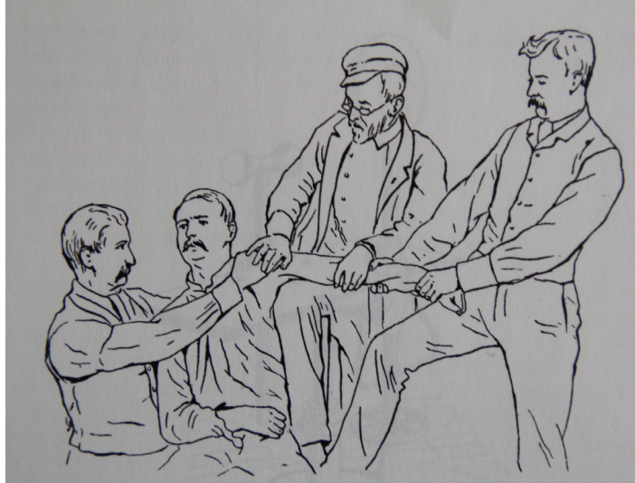
Figura 2. Hugh Owen Thomas reduciendo una luxación de hombro en el centro. El situado a la izquierda de Thomas es Robert Jones, su sobrino.

Pensaba que las enfermedades articulares no era fácil que condujeran a la anquilosis cuando se iniciaba pronto el tratamiento, de ahí la importancia del diagnóstico precoz. También creía que la anquilosis era consecuencia de la enfermedad y no de la inmovilización, y que el reposo debería mantenerse ininterrumpidamente. A mediados del siglo XIX, en Inglaterra era práctica común utilizar férulas o aparatos de inmovilización que se retiraban periódicamente para manipular la articulación con el fin de evitar la anquilosis. Esto fue anatema para Thomas. Algunos de los métodos por él empleados para conseguir inmovilización prolongada estaban al borde de la intimidación. Es posible que desconociera las consecuencias dañinas del reposo prolongado, por lo que él y sus seguidores fueron criticados 4 .