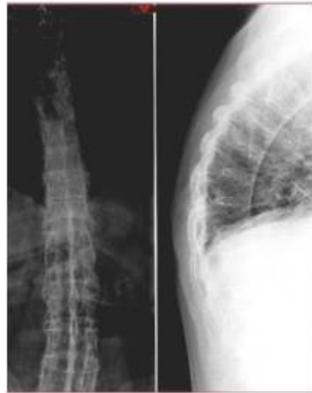
Figura 1. Rx posteroanterior y lateral de la columna torácica.

El paciente fue intervenido mediante artrodesis posterior instrumentada con tornillos pediculares 4 niveles por arriba y 3 por debajo (Fig. 3). La identificación de los puntos de entrada de los tornillos pediculares fue dificultosa porque la anatomía vertebral se encontraba alterada. Las carillas articulares, así como las articulaciones costovertebrales no se podían identificar al estar completamente fusionadas (Fig. 4). Para la inserción de los tornillos se empleó la técnica de manos libres sin radioscopia, asistido con medición intraoperatoria de la impedancia ósea de la esponjosa intrapedicular.