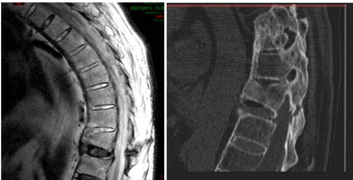
A B Figura 2. A: Cortes sagitales de RMN en T2 ( a ) B: TAC. Se observa el trazo de fractura a través del disco y arco posterior afectando a las tres columnas.

En el postoperatorio el paciente no llevó corsé. El alivio del dolor torácico fue inmediato tras la intervención y se mantuvo durante el seguimiento hasta la consolidación.