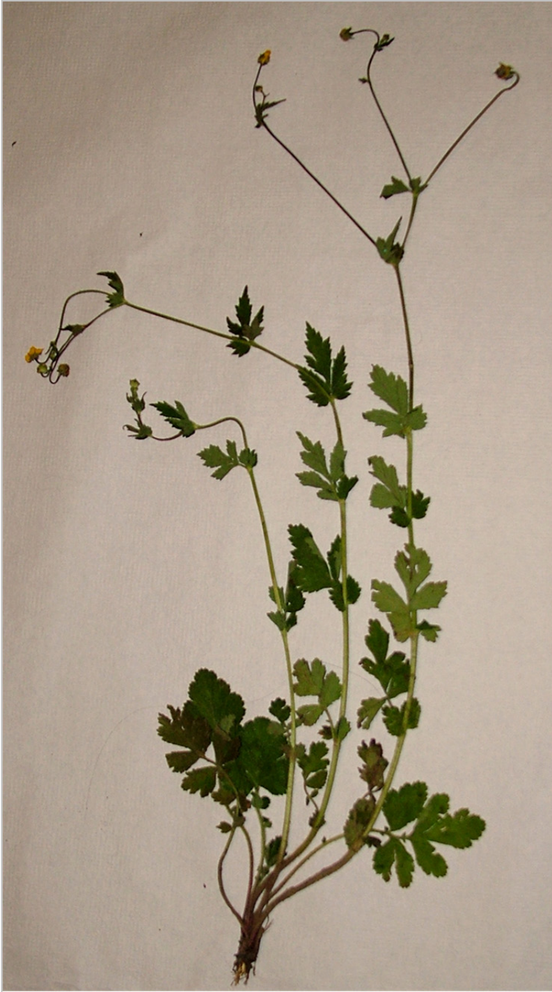
Fig. 4: Hábito de Geum × gonzaloi .