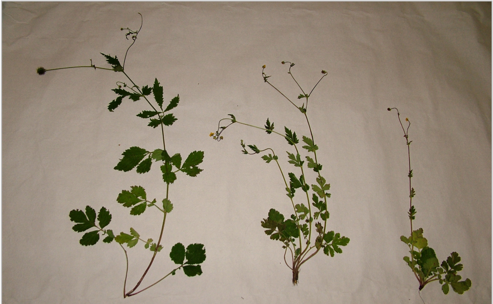
Fig. 1: De izquierda a derecha Geum urbanum (parte de la planta), G. × gonzaloi y G. hispidum respectivamente.

(Recibido el 10-XII-2013. Aceptado el 30-XII-2013)