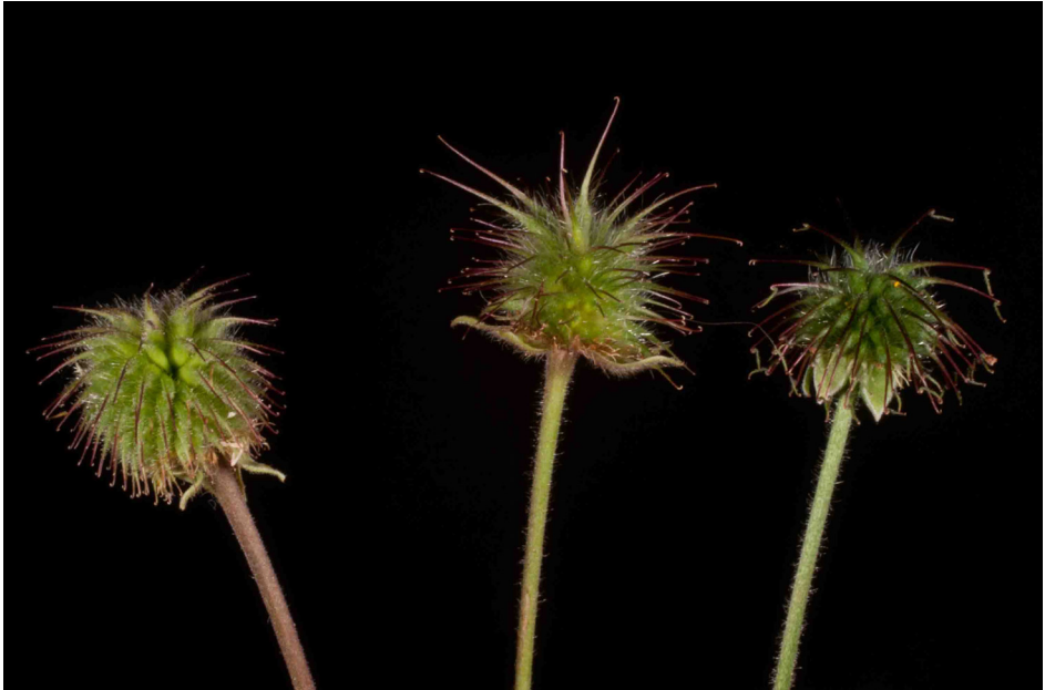
Fig. 2: Detalle de los frutos de Geum × gonzaloi y sus parentales. De izquierda a derecha: G. hispidum , G. × gonzaloi y G. urbanum , respectivamente.