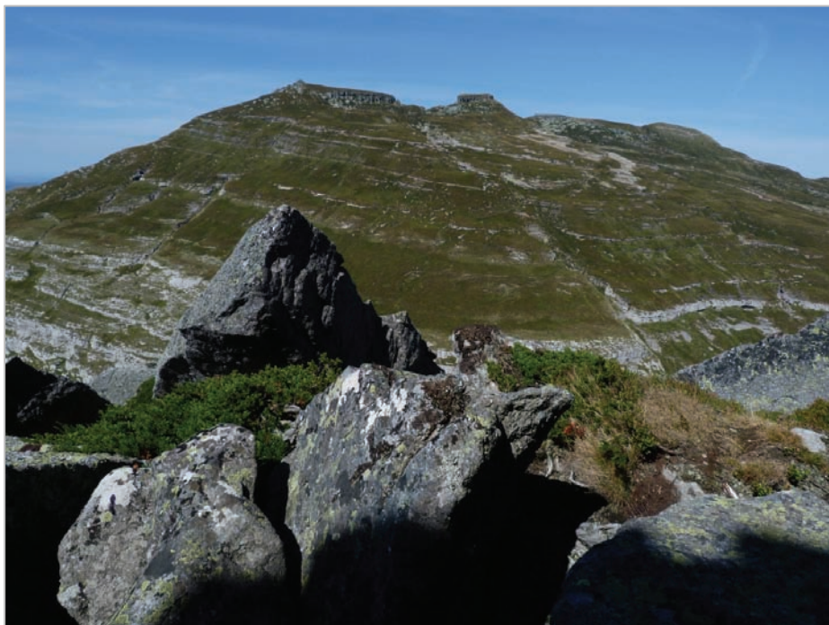
Fig. 7: Ladera sureste del Castro Valnera, a lo lejos, vista desde la base del roquedo norte de La Cubada Grande. Bajo la cumbre central se aprecian las descarnaduras de "las lastras".