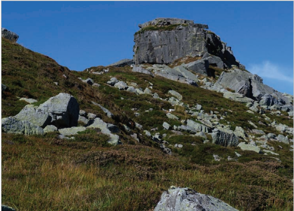
Fig. 6: Cumbre del Castro Valnera, de 1707 m. Ladera sureste. Por algo en la Pasieguería se le llama “El Castru”