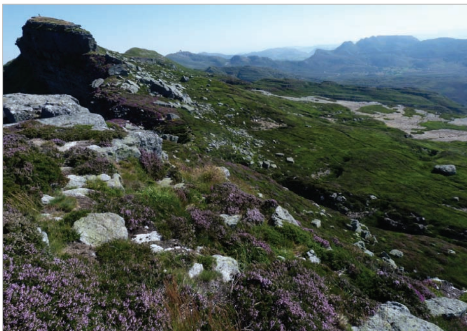
Fig. 8: Cumbre del Castro Valnera. Se aprecian las descarnaduras de "Las Lastras" en la falda este-sureste.