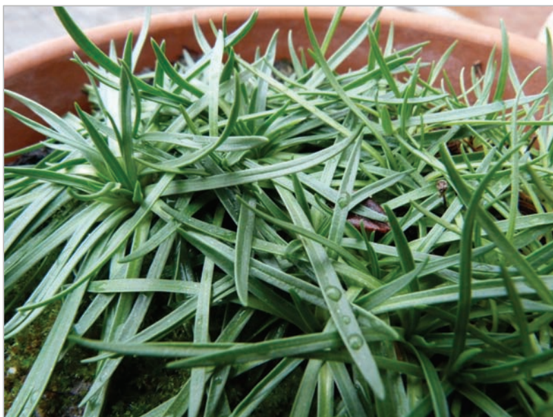
Fig. 11: Vista semilateral de una de las plantas cultivadas