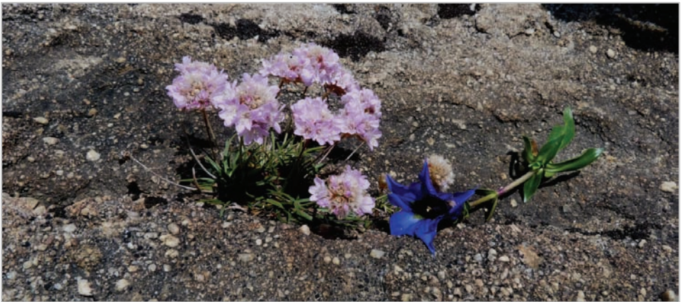
Fig. 2: Ejemplar característico de la población. Se aprecian las pequeñas fisuras en la lastra de microconglomerado, que apenas retienen materia orgánica. La planta de Gentiana angustifolia sirve para hacerse una idea del tamaño de la Armeria