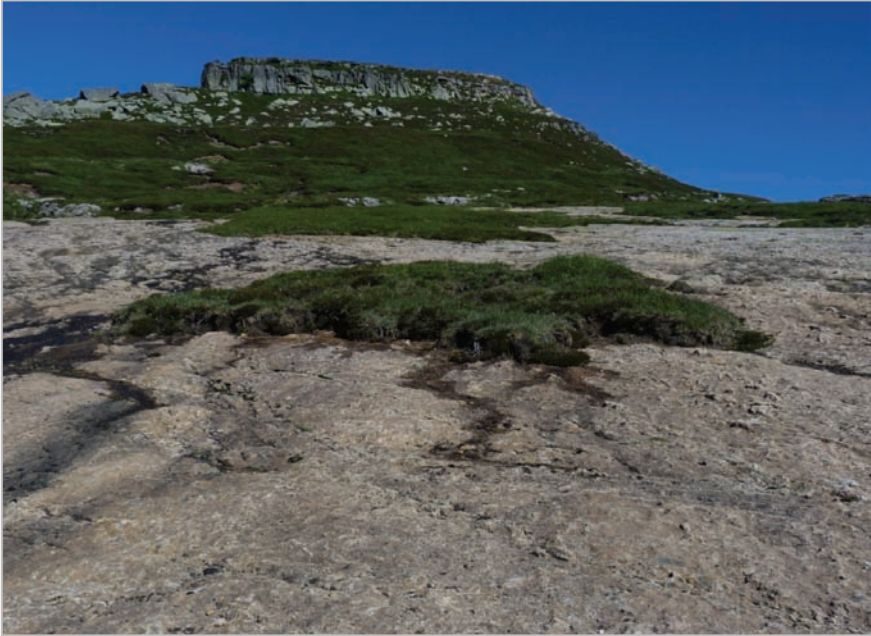
Fig. 9: Restos de la cubierta vegetal que cubría gran parte de las hoy descarnadas lastras