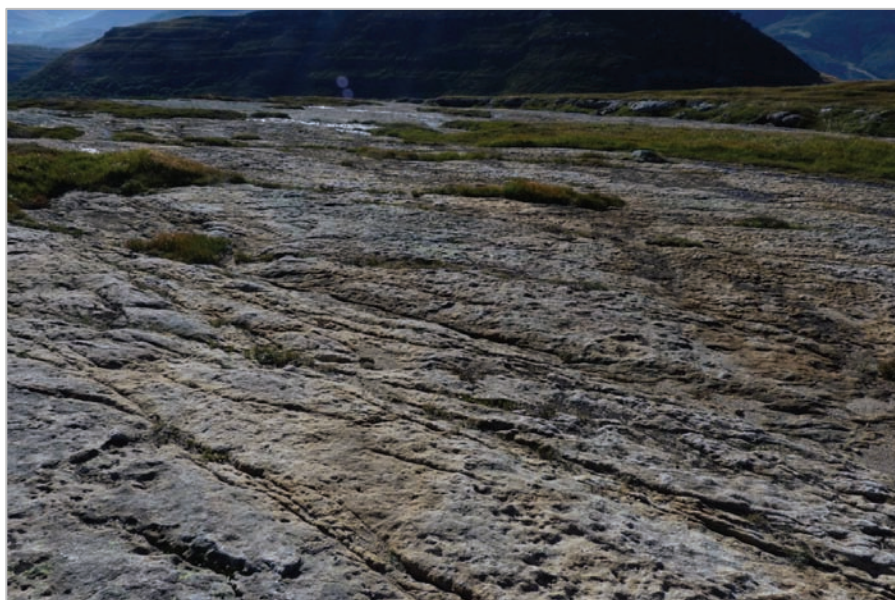
Fig. 4: “Las lastras”. Se aprecia la pendiente moderada y las escorrentías que circulan temporalmente por la superficie, esenciales para la supervivencia de la Armeria . Se aprecia, así mismo, el arrasamiento de la capa vegetal, los restos en forma de ísleos y en el reborde los sustratos alternantes (calizo/silíceos).