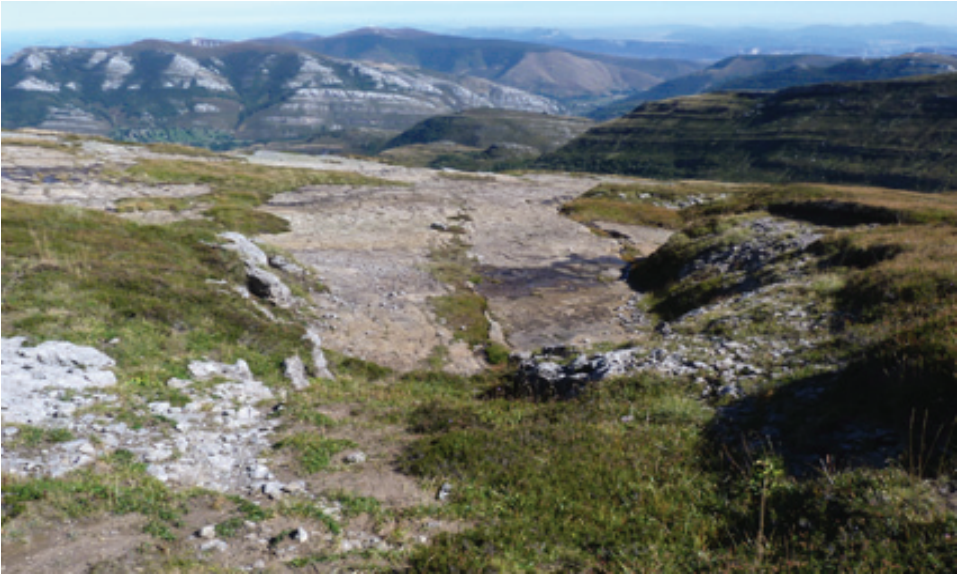
Fig. 5: Otra imagen de la zona de “las lastras”. Aquí se aprecia mejor la estructura geológica en forma de estratos alternantes: la lastra silíceo subyacente bajo un delgado estrato carbonatado karstificado. Los efluvios temporales surgen en el contacto de la caliza permeable y recorren la superficie impermeable del conglomerado silíceo hasta sumirse en un nuevo estrato calizo