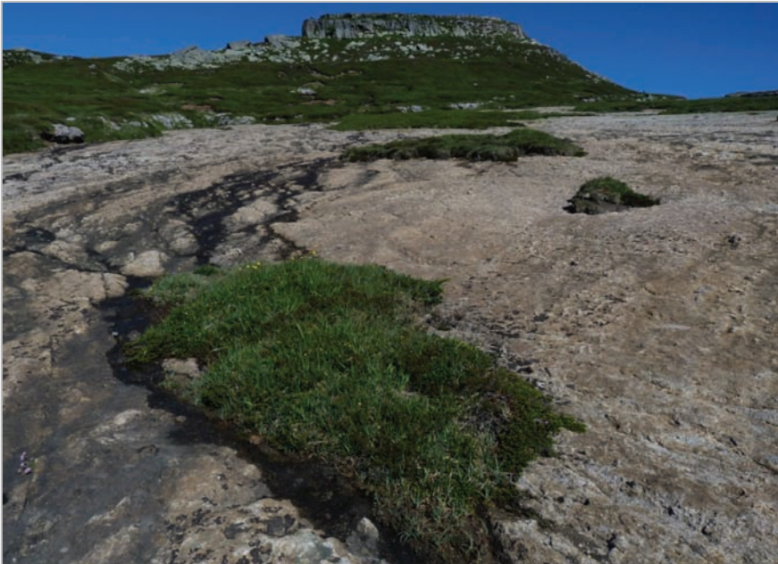
Fig. 10: Otra imagen que ilustra el mismo proceso de decapitación del suelo (relativamente frecuente en estas montañas debido precisamente a la alternancia de sustratos: calizo permeable y silíceo impermeable subyacente). Los efluvios laminares, el arrastre crionival y la pendiente moderada son los agentes directos que lo causan.