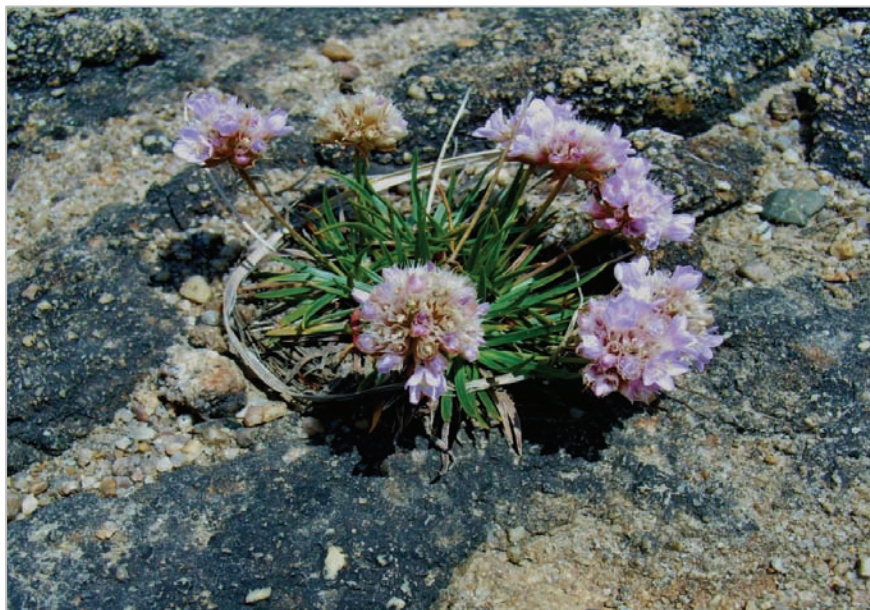
Fig. 3: Imagen de otro ejemplar de la población. El color negruzco de la roca (apreciable donde no hay erosión ni fisuras) se debe a los solutos que arrastran las aguas que discurren a veces sobre la placas y que se depositan en la superficie por efecto de la evaporación (ladera de escasa pendiente en solana)