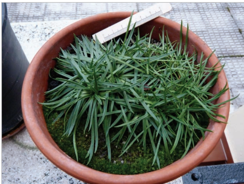
Fig. 12: Vista cenital de la misma planta