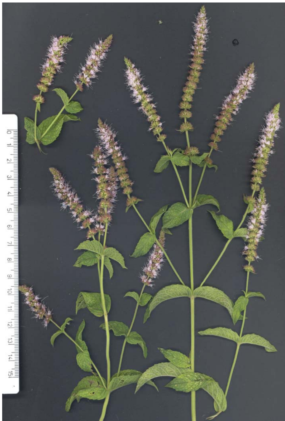
Fig. 4: Mentha x villosonevata , procedente de Olba (Teruel)