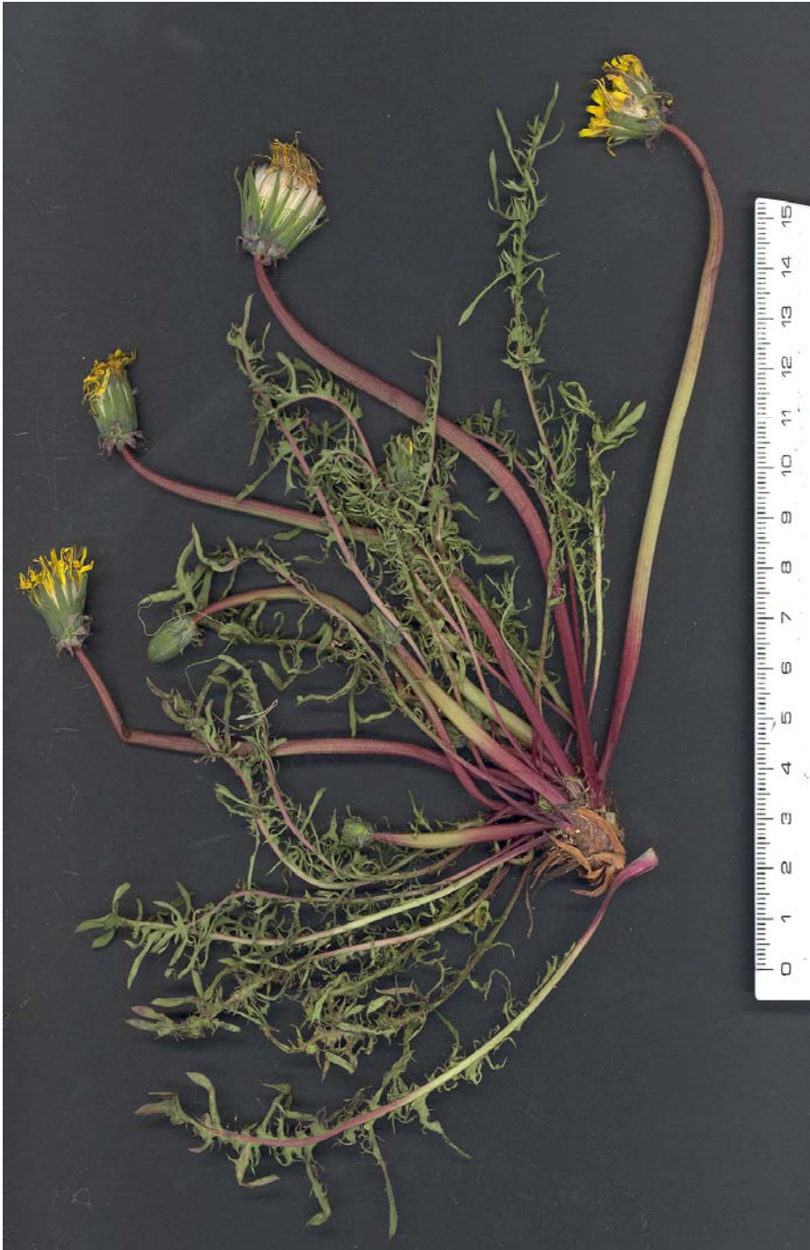
Fig. 5: Taraxacum gasparrinii procedente de la Sierra de Gúdar, entre Cedrillas y Corbalán.