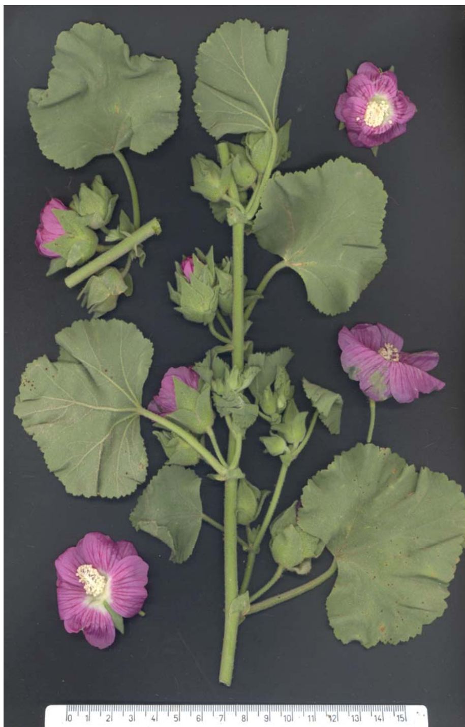
Fig. 3: Lavatera triloba , procedente de La Puebla de Valverde (Teruel)