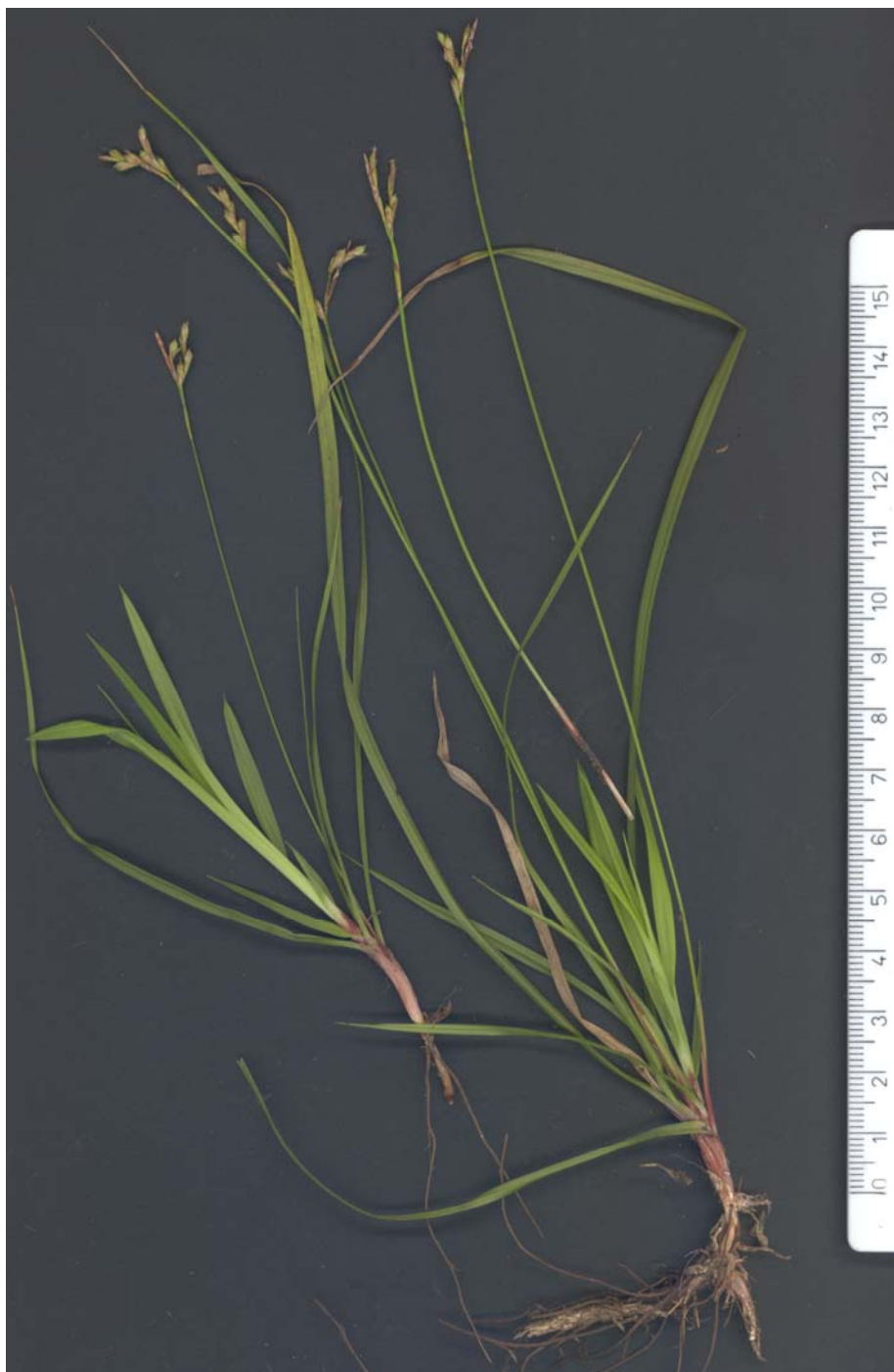
Fig. 2: Carex ornithopoda , procedente de Mosqueruela (Teruel)