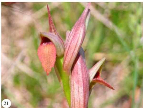
Foto 16. Orchis italica – Alcoi (L. Serra). Foto 17. Orchis papilionacea subsp. grandiflora – L'Orxa (L. Serra). Foto 18. Orchis purpurea – Banyeres (L. Serra). Foto 19. Orchis ustulata - Villena (J.C. Hernández). Foto 20. Orchis ustulata – L'Orxa (A. Cutillas). Foto 21. Serapias parviflora – Villanueva de Castellón (J. Oltra)