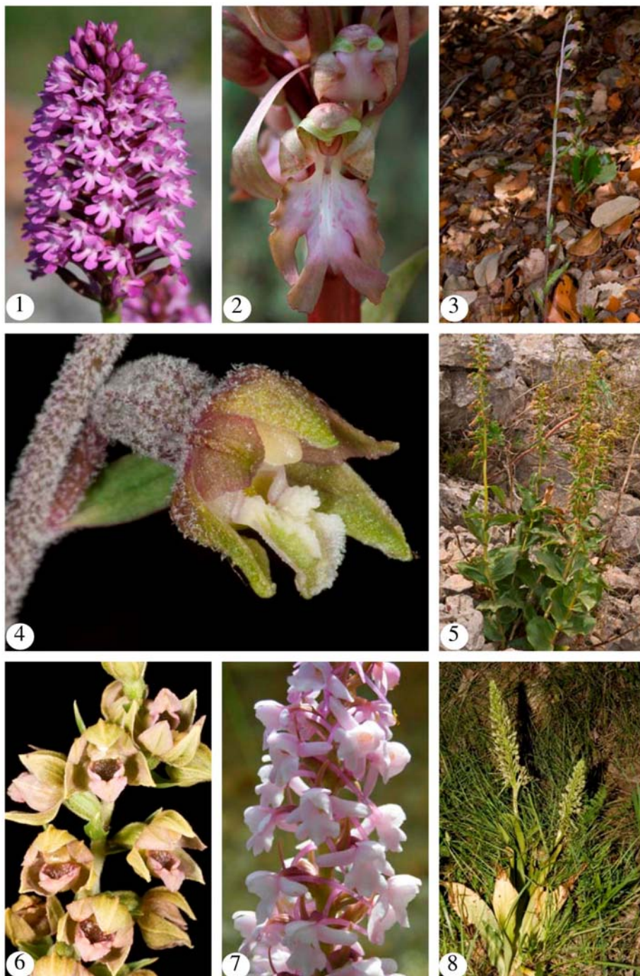
Foto 1. Anacamptis pyramidalis – Bocairent (A. Sanz). Foto 2. Barlia robertiana – Alcoi (F. Durà). Foto 3. Epipactis microphylla – El Toro (L. Serra). Foto 4. Epipactis microphylla – El Toro (A. Cutillas). Foto 5. Epipactis tremolsii – La Romana (L. Serra). Foto 6. Epipactis tremolsii – La Romana (L. Serra). Foto 7. Gymnadenia conopsea – Enguera (J. Oltra). Foto 8. Himantoglossum hircinum – Bocairent (A. Conca).